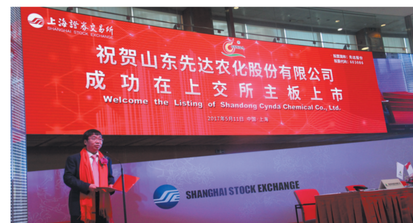
先达农化成功在上交所主板上市