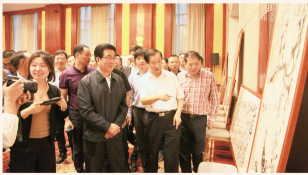
甘肃省委书记、省人大常委会主任林铎参观吴东魁先生捐赠希望小学的书画精品展览，给予高度评价。