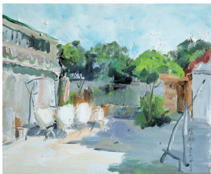
■ 小院晨光 60cm x 70cm