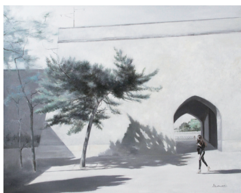
■ 影 150cm x 120cm