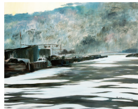
■ 湖光山色 100cm x 80cm