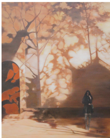
■ 沉思的女孩 120cm x 100cm