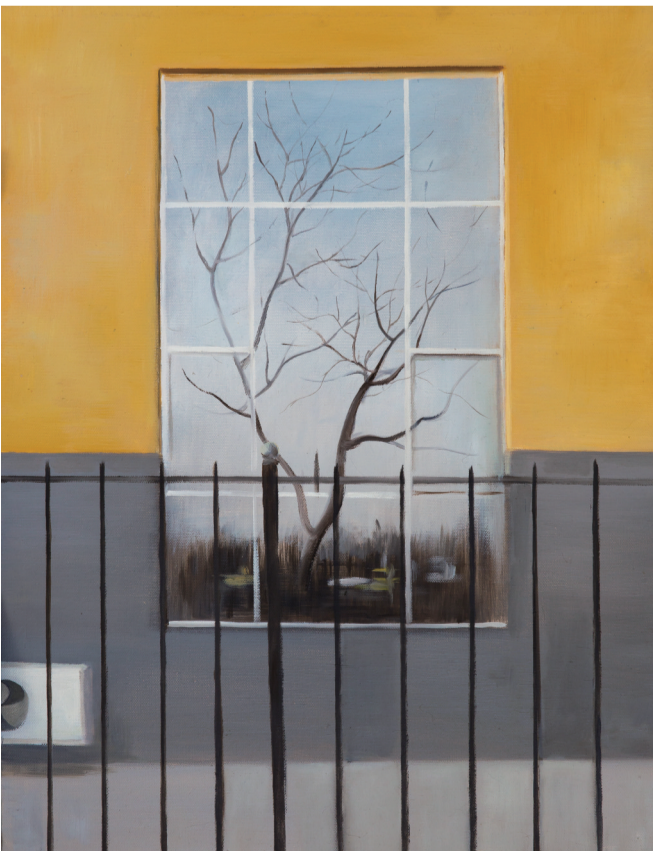
■ 窗·影 80cm x 60cm