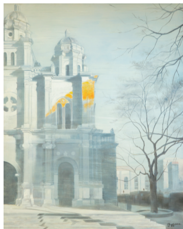
■ 圣殿之光 150cm x 120cm