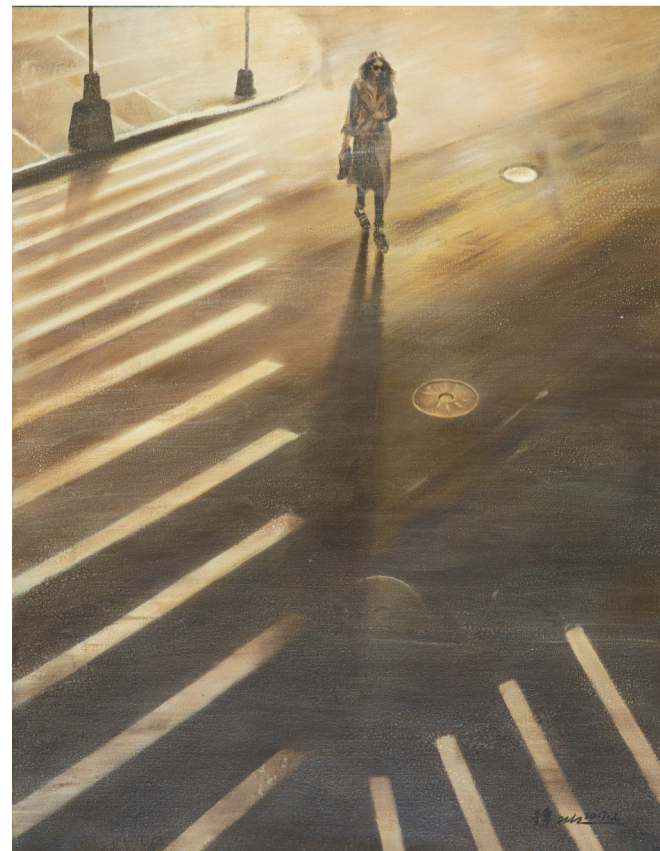
■ 逆光中的女孩 80cm x 60cm