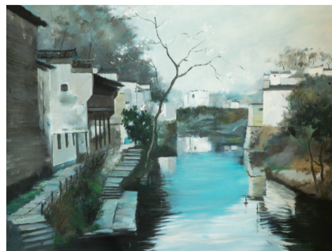
■ 江南初春 120cm x 90cm