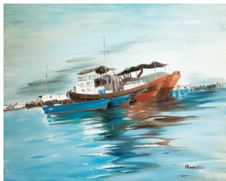
■ 远航 100cm x 80cm