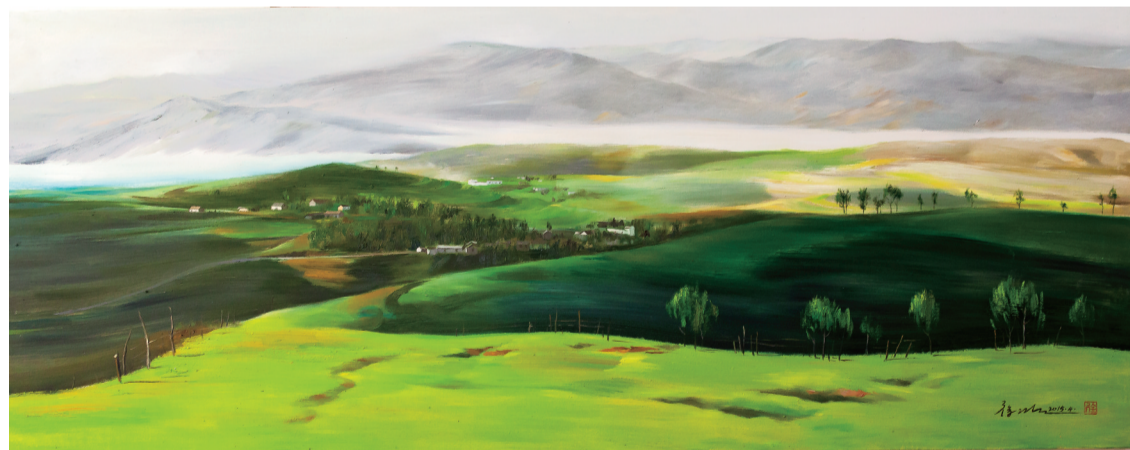
■ 草原晨光 200cm x 80cm