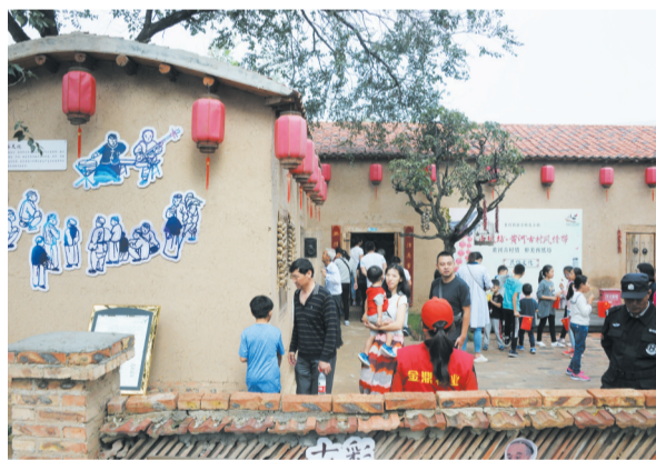
独具特色的民居让游客体验到不同的居住文化。