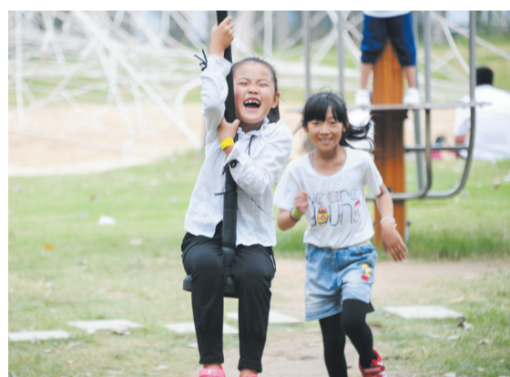
景区内的游乐设施让孩子们玩得亦乐乎。