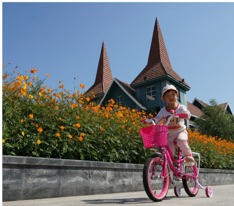
四季皆有景,处处有花香。秦皇河畔秋花正绚烂,市民赏玩正当时。

同时,秦皇河三期野花组合花田播种近10万平方米,主要品种有百日草、硫华菊、波斯菊、二月兰、金鸡菊、大滨菊等,现在正盛开的是百日草、硫华菊、波斯菊,今后每年从3月份至11月份都有各式各样的鲜花盛开,供市民尽情赏玩。