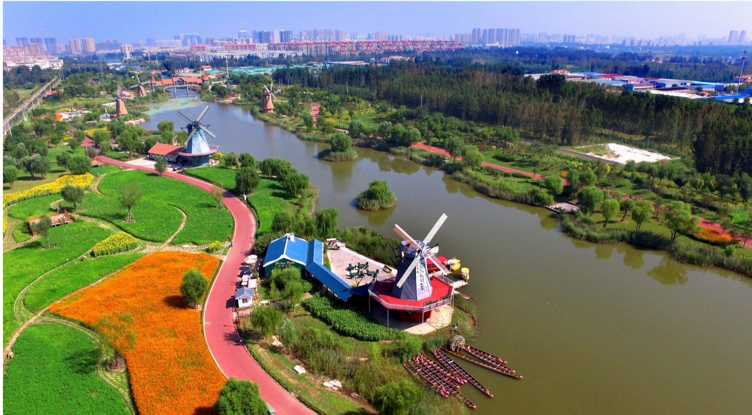
湛蓝的天、洁白的云、浓绿的叶、斑斓的花,漫步秦皇河公园,一路美景一路芬芳。