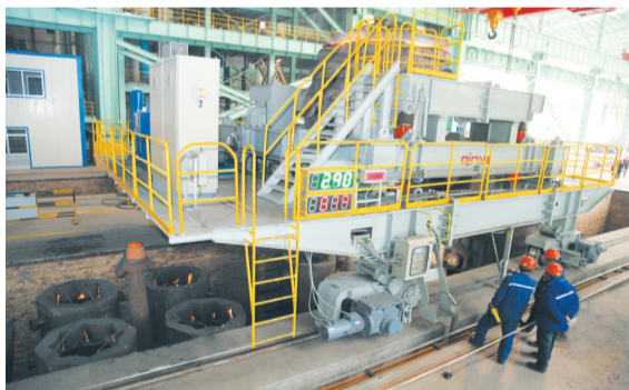
国内第一台智能化浇钢车。