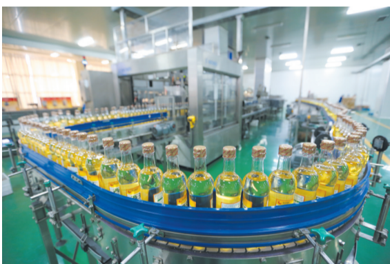
全国最大的玉米油生产基地。