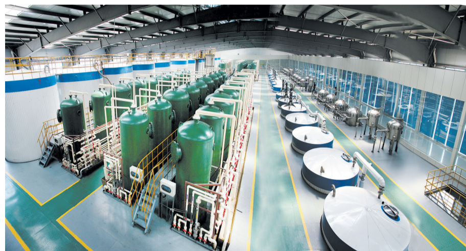
国内唯一的玉米果糖产业化生产车间。

西王集团始建于1986年，历经31年发展，成为一家以玉米深加工和特钢生产为主业，兼项投资运动营养食品、物流、金融、国际贸易等产业的全国大型企业，拥有西王食品、西王特钢、西王置业三家上市公司和西王集团财务有限公司。位列2017中国企业500强第416位、中国制造业500强第193位。分别于2006年5月、2010年8月被中国食品工业协会冠名“中国糖都（淀粉糖）”、“中国玉米油城”。 在中国经济深层次结构调整、新旧动能转换的关键时期，西王集团主动适应、积极引领经济发展新常态，牢牢把握“走在前列”的目标定位，以供给侧结构性改革为主线，以加快实施新旧动能转化重大工程为抓手，立足玉米深加工和特钢两大主业，深化创新驱动，加快转型升级，全面打造企业发展的新动能和新优势，用实际行动践行“创新、协调、绿色、开放、共享”五大发展理念，保持了稳健向上向好的强劲发展态势。2017年1-9月份，企业实现销售收入327亿元，利税16.6亿元，上交税金7.6亿元，分别同比增长了39.1%、78.1%、43.4%。