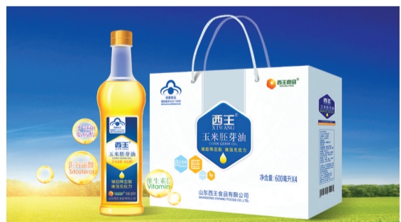
9月8日，全新升级的西王保健玉米胚芽油盛装亮相，开启植物油保健的新时代。

元。从进入中国市场短短几个月的时间，肌肉科技运动营养保健品的市场增长率超过100%。