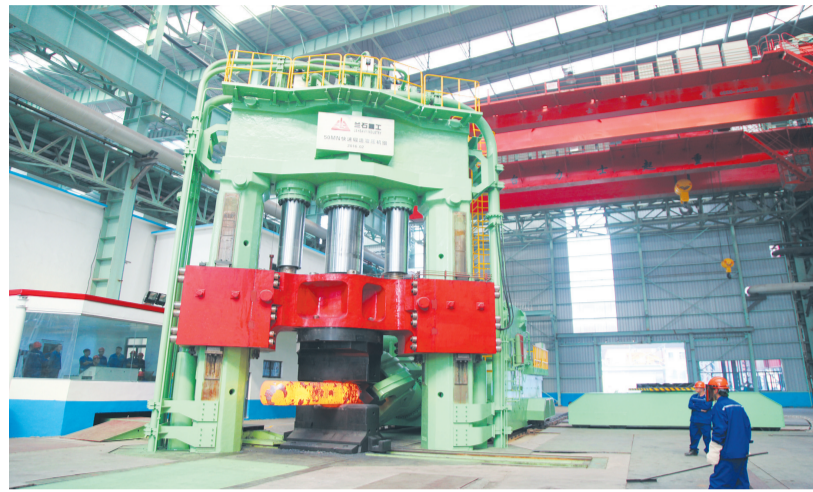
西王特钢与中科院金属研究所合作打造的清洁智能化制备高端装备用特殊钢示范生产线二期项目。