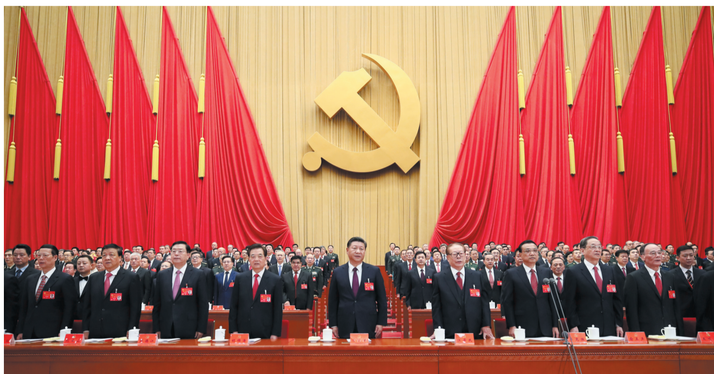
10月18日，中国共产党第十九次全国代表大会在北京人民大会堂开幕。这是习近平、李克强、张德江、俞正声、刘云山、王岐山、张高丽、汪洋、胡锦涛在主席台上。

大会的主题是： 不忘初心，牢记使命，高举中国特色社会主义伟大旗帜，决胜全面建成小康社会，夺取新时代中国特色社会主义伟大胜利，为实现中华民族伟大复兴的中国梦不懈奋斗。