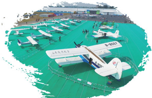
首届低空旅游发展大会、旅游装备博览会