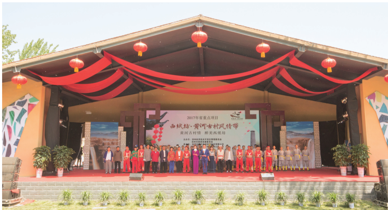
西纸坊·黄河古村风情带