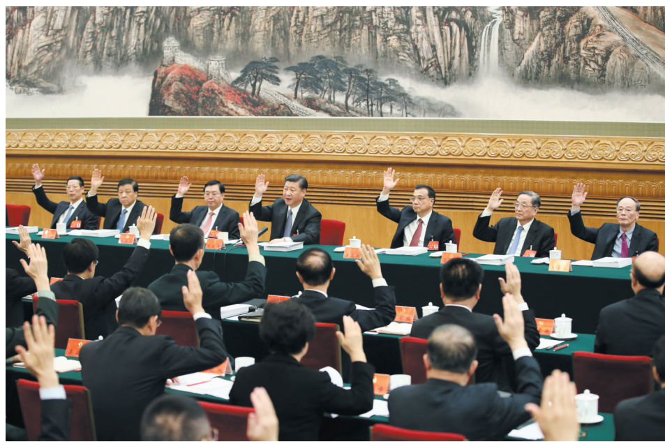
上图:10月23日,中国共产党第十九次全国代表大会主席团在北京人民大会堂举行第四次全体会议。习近平、李克强、张德江、俞正声、刘云山、王岐山、张高丽等出席会议。