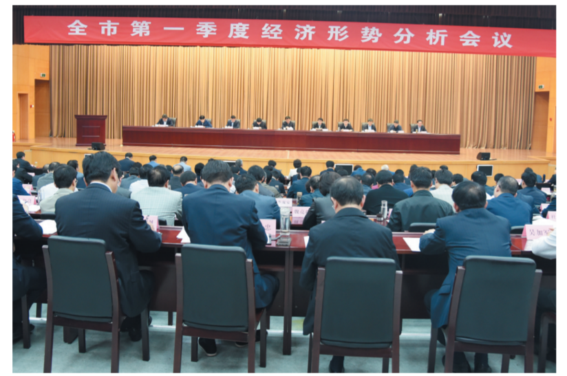
全市第一季度经济形势分析会议召开