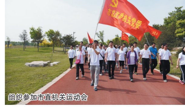
组织参加市直机关运动会