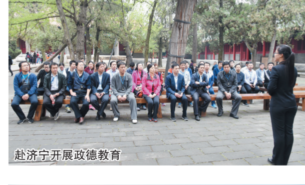
赴济宁开展政德教育