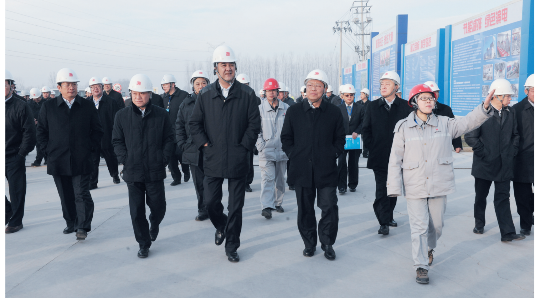
国家发改委副主任、国家能源局局长努尔·白克力来滨调研,市委书记、市人大常委会主任张光峰陪同

抓改革增活力,当好经济改革的“规划部”。着力推进供给侧结构性改革,认真落实“三去一降一补”五大任务,为实体经济注入新活力。深化“放管服”改革,率先在全省开展投资项目在线审批监管平台,努力打造“审批少、效率高、服务好”“最多跑一次”的政务环境。医改工作走在全省前列,成功获批“公立医院改革国家联系试点城市”,公立医院改革被评为全市“争一流、上水平”优秀成果。在全省率先完成市、县、乡三级党政机关公务用车制度改革。社会信用体系建设在全省实现“四个领先”。顺利搭建“公共信用信息平台”,建立诚信“红黑榜”,守信激励惩戒机制初步形成,全社会诚信意识和信用水平不断提高,营商环境持续改善。全市城市信用监测综合指标位、政府机构失信问题专项治理等工作走在全省前列。