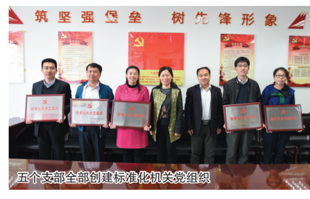
五个支部全部创建标准化机关党组织