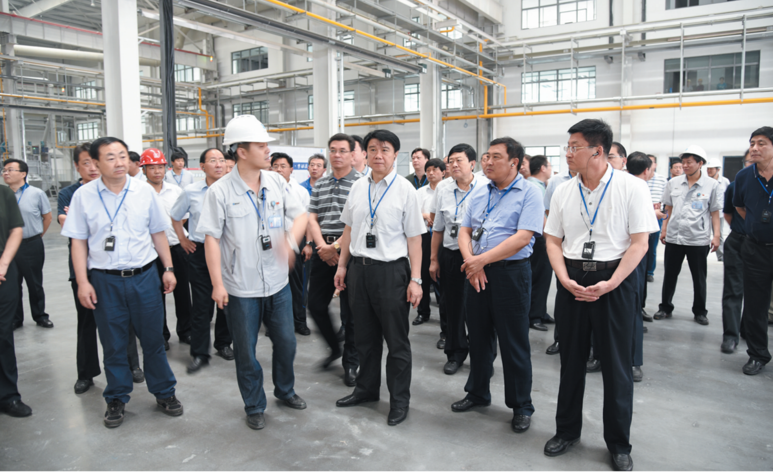
市委副书记、市长崔洪刚率队现场观摩全市重点建设项目

今年以来,市发改委牢固树立“抓好党建是最大政绩”理念,深入开展“全国文明城市”创建活动,以党建促创建,以创建促党建,相互融合,统筹推进,干部队伍素质显著提升。连续6年被授予省级文明单位,牢固树立“四个意识”,设立“周末讲堂”全员学,每周一主题、每月一研讨、学思践悟,共同提升,全力打造“六有”发改队伍。创新实践载体,集中开展“三亮三树”、“主题党日”、“讲规矩、守纪律、做表率”等系列主题活动,强化党员意识,激发党员活力,争做“四讲四有”合格党员。集中开展廉政谈话活动,抓早抓小,防微杜渐,让“咬耳扯袖、红脸出汗”成为常态,这一做法被省发改委作为典型经验推广。