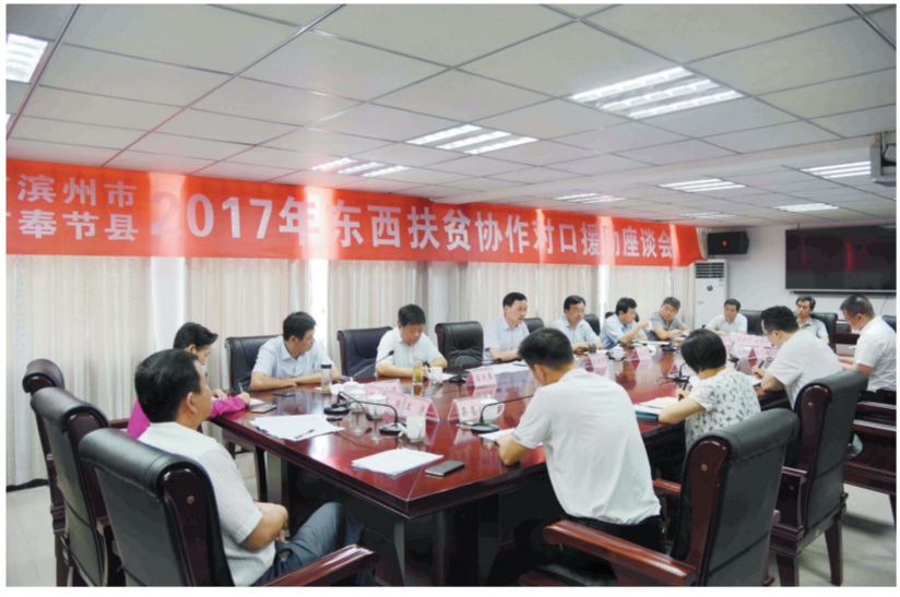
市委常委、常务副市长赵广平率代表团赴重庆市奉节县对接扶贫协作工作,并召开滨州市扶贫协作奉节县工作座谈会