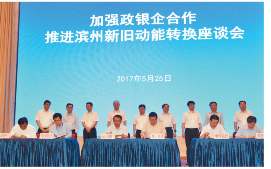
加强政银企合作,推进滨州新旧动能转换座谈会在济南召开