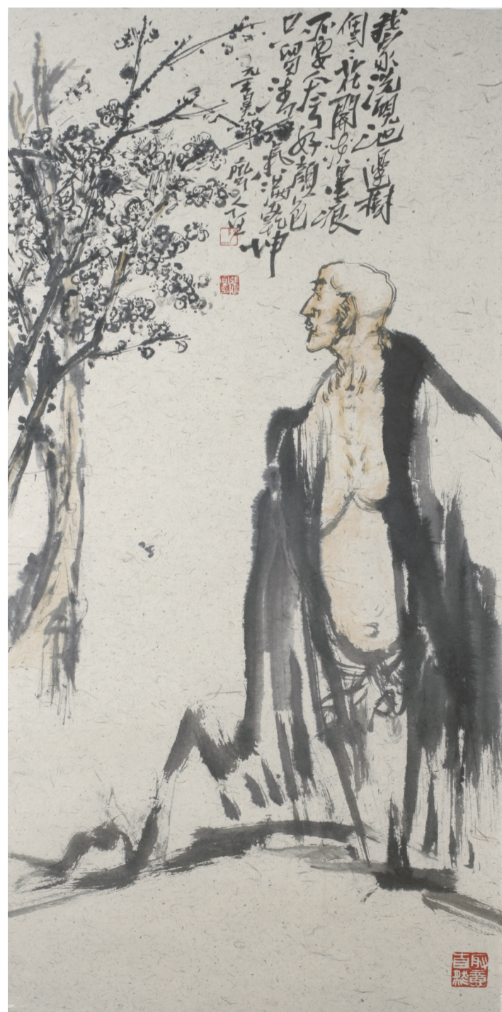
只留清气满乾坤 69cm X 140cm