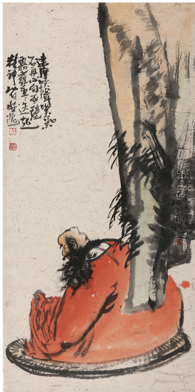
达摩不再面壁 70cm X 140cm