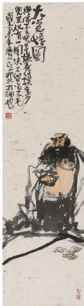
大觉灵化 35cm X 140cm