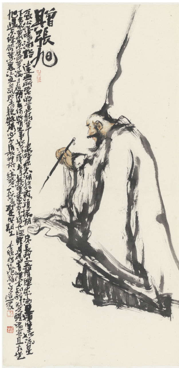
赠张旭 69cm X 139cm