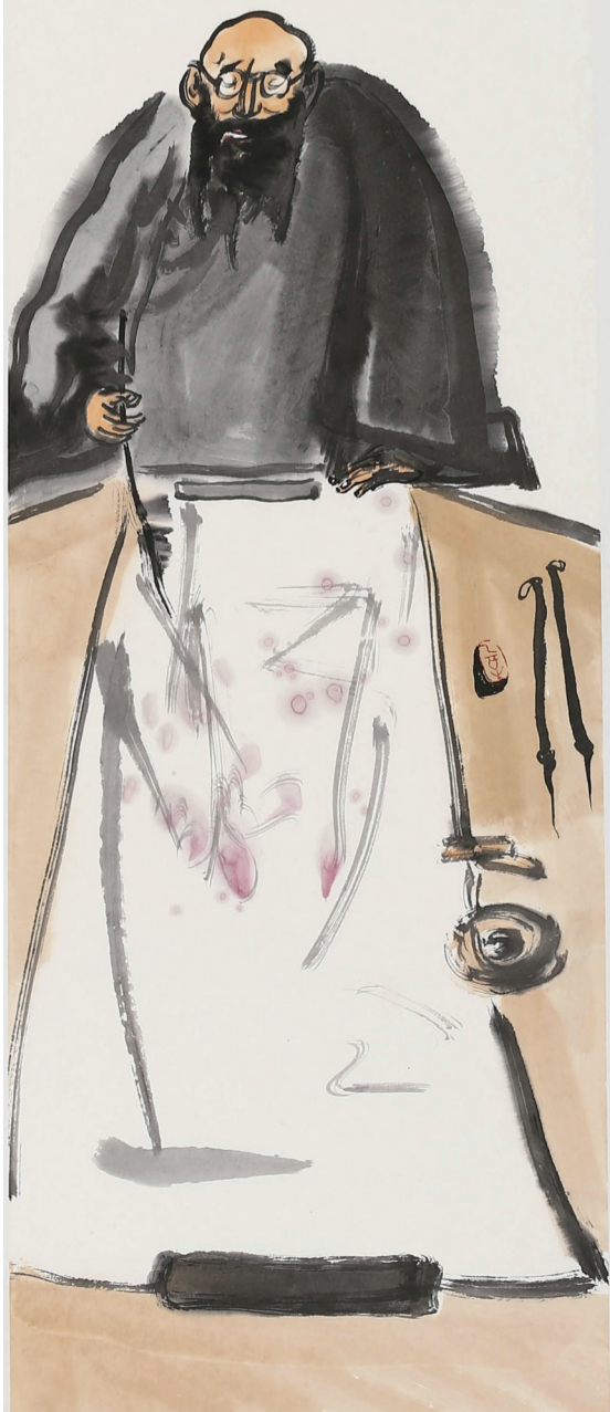
正可解衣入我怀 34cm X 138cm