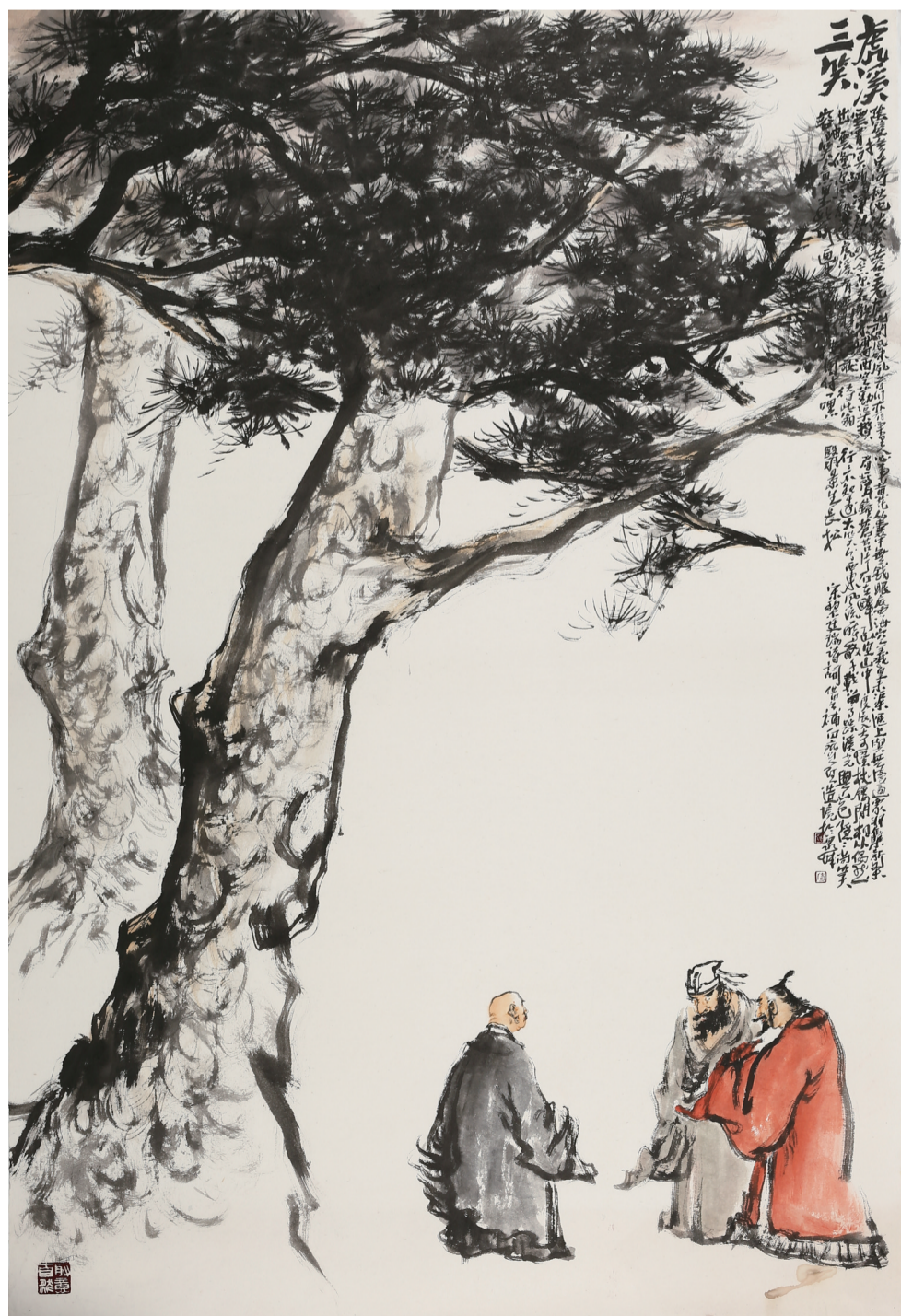
虎溪三笑 138cm X 200cm