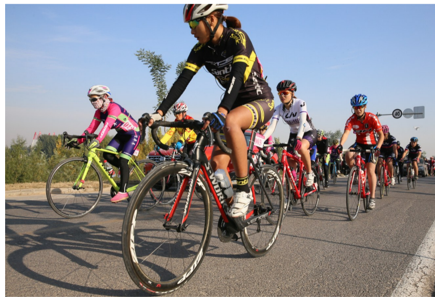
女选手们“巾帼不让须眉”,矫健的身姿成为大坝上最靓丽的风景。