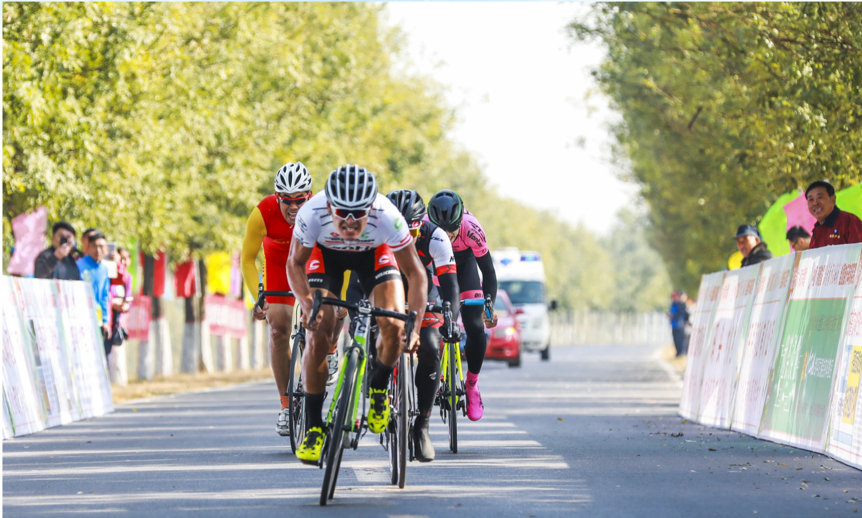
激动人心的撞线一刻!