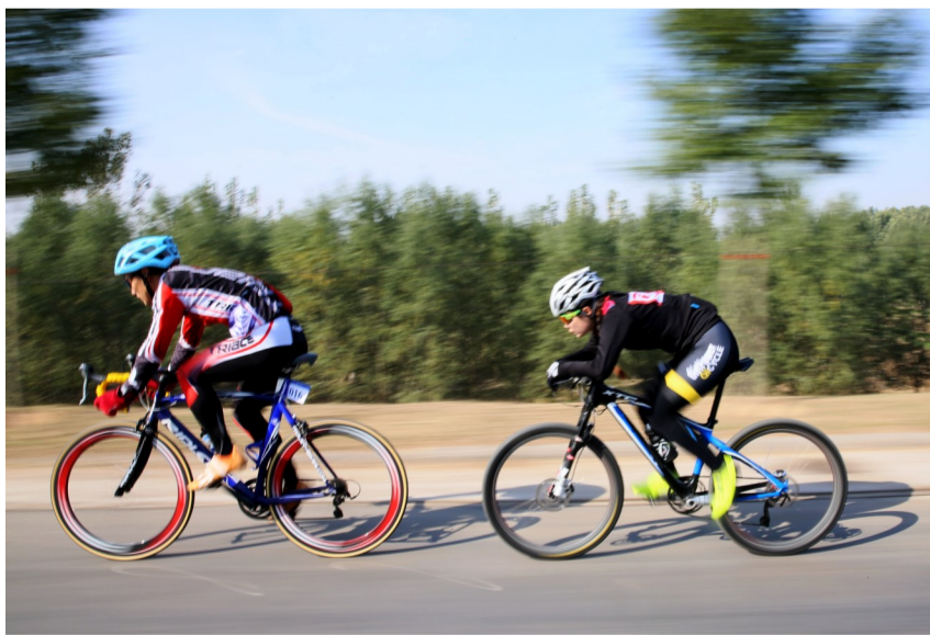
诠释力与美的结合。