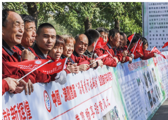
附近群众兴致勃勃地观看比赛。