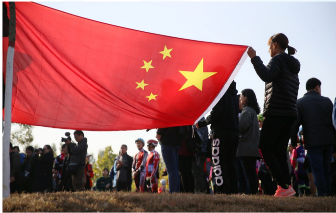
开幕式上,众人齐唱国歌。

滨州日报/滨州网记者 李默 葛肇敏 任宵 张丹 王健 通讯员 徐淳理 赵秀瑞 傅琨