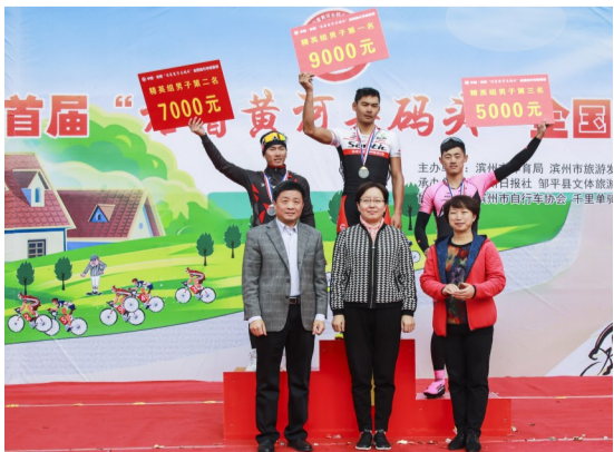
男子精英组前三名领奖。