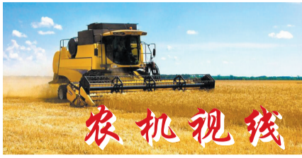
滨州日报/滨州网讯(记者 孙文杰 通讯员 张美芳 高强 报道)日前,记者从市农机局获悉,截至10月20日,我市秋季农机化生产圆满结束。

“三秋”生产开始以来,市农机局早谋划、早部署、早准备,强化信息动态管理,科学调度抢收机械,推进秸秆综合利用,全市共上阵各类农机具4.4万余台套,其中玉米联合收获机8118台,机