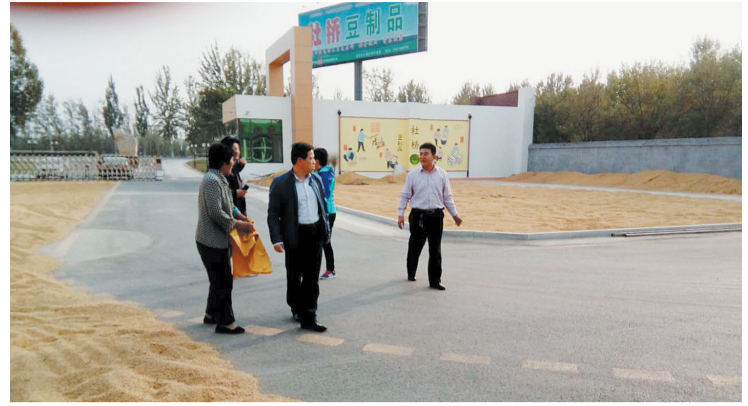
今年惠民县清河镇东方豆制品有限公司1000余亩大豆喜获丰收,每亩产量达200公斤以上。近年来,公司在杜桥村、跑马刘村等村发展大豆种植,有效促进了村集体增收、村民致富。公司董事长杜美收介绍,今年的大豆价格4.4元每公斤,目前公司基地所有大豆已收获完毕。