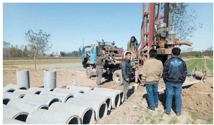
近日,惠民县清河镇小农水节水灌溉工程启动,林樊社区正在施工的小农水节水灌溉工程投资12万元、覆盖400亩良田。该镇水利站负责人刘云介绍,该工程建成后,将从根本上解决广大农民“浇地难”问题,同时还节约了用水。