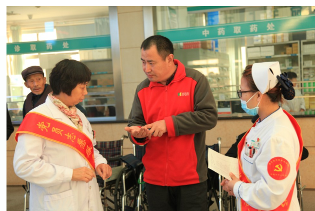
认真聆听群众诉求,全力做好服务工作。