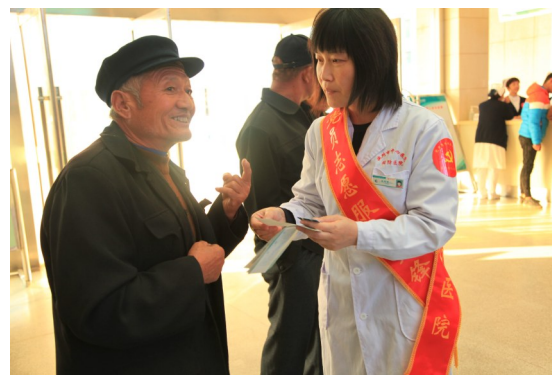
优质服务赢得群众满意和好评。

为充分发挥党员的先锋模范作用,激励广大党员弘扬“奉献、友爱、互助、进步”的志愿者服务精神,日前,滨州市中心医院党员志愿服务先锋队正式成立。医院171名正式党员和预备党员(占在职党员80%)、32名入党积极分子自愿报名参加志愿服务活动。