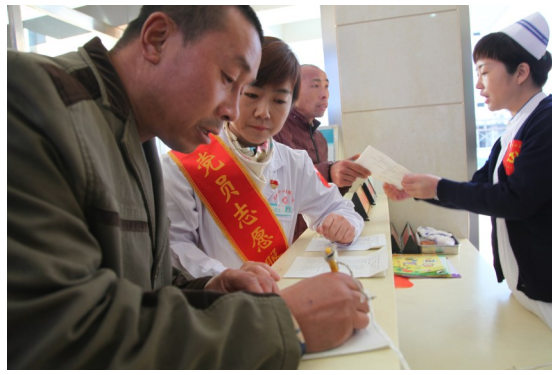
帮助就诊患者家属登记信息。