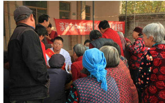
走村入户开展义诊,让老年、贫困群众乐享免费医疗