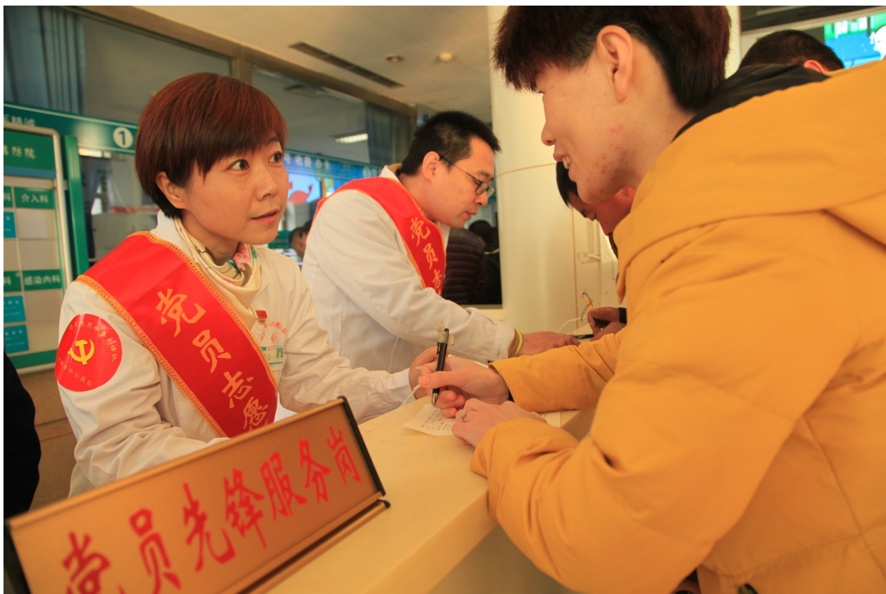
志愿者统一佩戴“党员志愿先锋队”绶带和臂标,展现出良好医院形象。