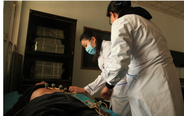
为老年群众进行查体,做到疾病早发现早治疗。