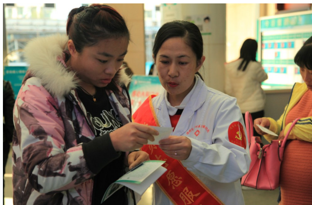
用耐心细致的服务营造和谐就诊环境。