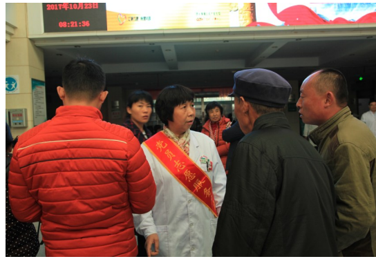
面对面沟通交流,了解就医群众所思所想,让志愿服务落到实处。