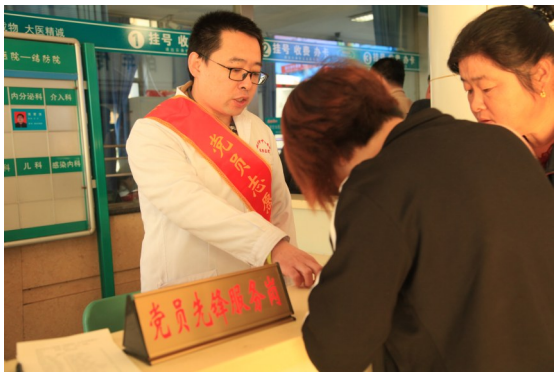
党员先锋服务岗标牌摆放在显眼位置,便于群众咨询。