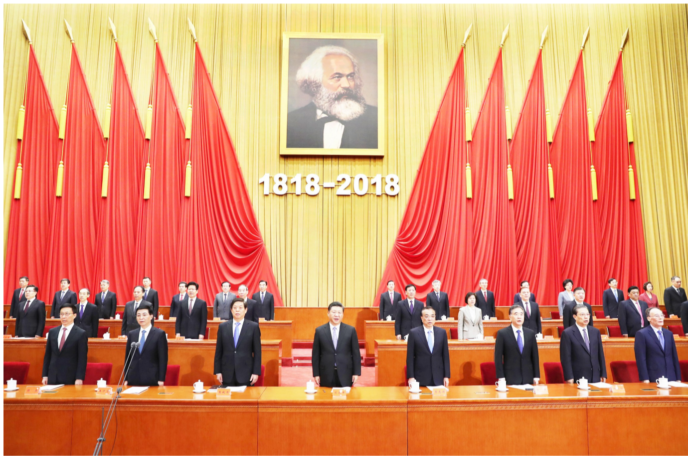
5月4日，纪念马克思诞辰200周年大会在北京人民大会堂隆重举行。习近平、李克强、栗战书、汪洋、王沪宁、赵乐际、韩正、王岐山等出席大会。

新华社北京5月4日电 纪念马克思诞辰200周年大会4日上午在北京人民大会堂隆重举行。中共中央总书记、国家主席、中央军委主席习近平在会上发表重要讲话强调，我们纪念马克思，是为了向人类历史上最伟大的思想家致敬，也是为了宣示我们对马克思主义科学真理的坚定信念。马克思主义始终是我们党和国家的指导思想，是我们认识世界、把握规律、追求真理、改造世界的强大思想武器。新时代，中国共产党人仍然要学习马克思，学习和实践马克思主义，高举马克思主义伟大旗帜，不断从中汲取科学智慧和理论力量，更有定力、更有自信、更有智慧地坚持和发展新时代中国特色社会主义，让马克思、恩格斯设想的人类社会美好前景不断在中国大地上生动展现出来。 李克强、栗战书、汪洋、王沪宁、赵乐际、韩正、王岐山出席大会。 人民大会堂大礼堂气氛庄重热烈。主席台上方悬挂着“纪念马克思诞辰200周年大会”会标，后幕正中是马克思画像和“1818—2018”字标，10面红旗