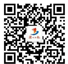
滨州日报微信公众号