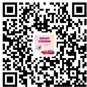
扫描二维码观看精彩直播

下一步,滨州网将不断积极发挥“连接滨州的桥梁”的作用,精心举办各种形式、各种主题的文化惠民活动,为滨州市民搭建文体活动平台,提供更广泛的展示自我风采的舞台。