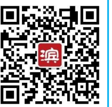
滨州网微信公众号