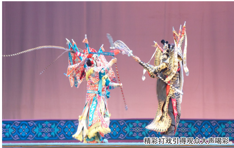
精彩打戏引得观众大声喝彩。

滨州日报/滨州网讯(记者 刘青博 通讯员 薛坤 王蒙蒙 报道)8月5日,第二届滨州文化惠民消费季系列活动“周末戏相逢”剧场演出活动在滨州影剧院上演了精彩的京剧折子戏。与之前不同,此次演出,市京剧团邀请到了中国戏曲学院学生联袂为市民奉献了《文昭关》《天女散花》《火烧余洪》三折精彩好戏。其中既有文戏又有武戏,让广大戏迷过足了“戏瘾”,现场掌声不断。