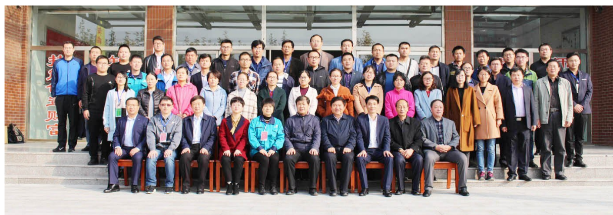
指导教师领队合影。