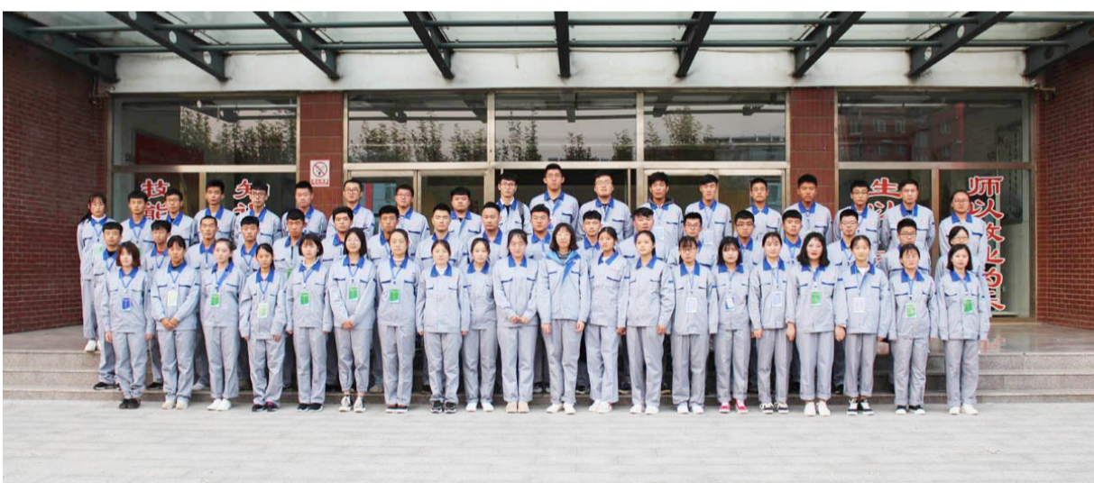
生产技术选手合影。