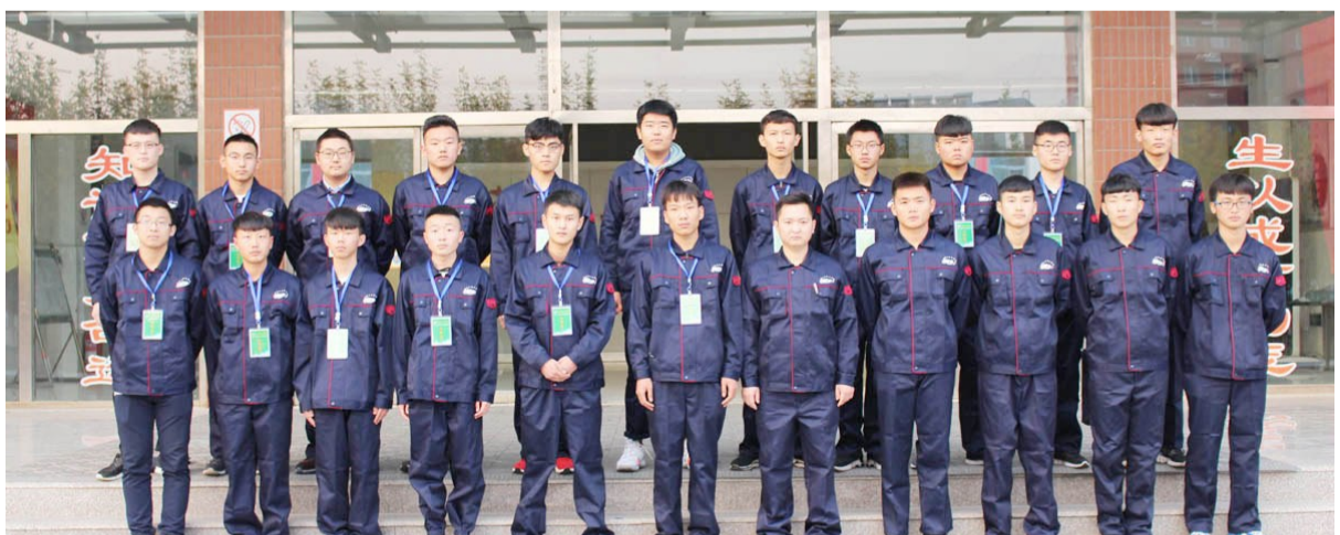
设备维修选手合影。