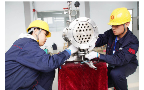
选手全身心投入比赛。