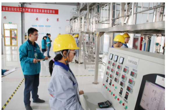
精馏比赛设备先进。