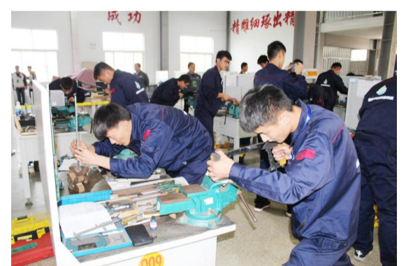
钳工镶配件制作赛场。