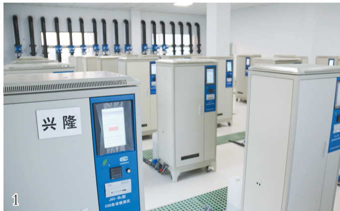
劳店镇陈楼工贸园区“一企一管”工程建成使用,确保园区企业污水稳定达标排放。

总投资6400多万元,完成了园区中水回用、“一企一管”、污水处理厂升级改造等工程建设,为皮革产业持续健康发展奠定了坚实基础。目前,陈楼污水处理厂正在持续调试,运行良好,经第三方检测,出水已经达到国家一级A排放标准,正在组织验收。不断加强园区企业监管,组建了园区环保执法中队,安排专人24小时值班,实行常态化巡查,严肃查处各类环境违法行为,防止污染事故的发生。