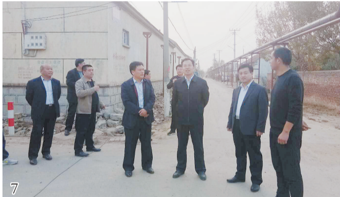
2018年11月9日,阳信县委副书记、县长刘荃一到劳店镇检查指导生物质清洁取暖工作。

镇党委、政府高度重视东官庄、西官庄村棚改工作,将其作为“两大工作主战场”之一,成立了由镇党委书记任政委、镇长任指挥,6名班子成员和16名同志参与的强有力的棚改指挥部,举全镇之力,全力以赴抓好抓实。经过四个多月的艰苦奋战,截至2018年9月份,2村棚改协议签订率、房屋腾空率均达到100%,棚改推进质量和速度走在了全县前列。2018年8月28日,县委书记栗兴刚到东官庄村、西官庄村视察棚改工作,对其给予充分肯定和高度评价。