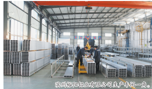
滨州裕阳铝业有限公司生产车间一角。

如月之恒,如日之升。成绩和荣誉属于过去,拼搏和奋斗成就未来。2019年,劳店镇党委、政府将坚持以习近平新时代中国特色社会主义思想为指导,全面贯彻党的十九大和十九届二中、三中全会精神,围绕推进县委“五城同建、五区并进”“五五战略”深入实施,按照“一二三四五”工作新思路,紧扣“一条主线”(工作落实年)、突出“两个重点”(带队伍、转作风)、完成“三大任务”(环保工作、棚改工作、精准扶贫)、打赢“四大战役”(做好全国“两会”、纪念“五四运动”100周年、庆祝建国70周年、纪念澳门回归20周年等4大重要时间节点社会稳定工作)、推进“五大工程”(突出党建引领,夯实班子建设;搞好环境整治,助推生态文明;加快双招双引,集聚园区动能;抓好安全生产,保障工业运行;打造文化强镇,涵养乡风民风),继续保持锐意进取、永不懈怠的精神状态和敢闯敢干、一往无前的奋斗姿态,凝心聚力、苦干实干,为高质量高水平建设大美富强、和谐幸福新劳店而努力奋斗,以经济社会发展的优异成绩,迎接中华人民共和国成立70周年!