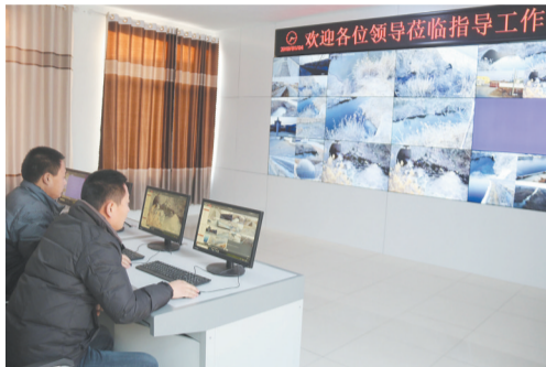
陈楼工贸园区智能监控系统建成运行,为打造“智慧园区”插上了科技的翅膀。

如月之恒,如日之升。成绩和荣誉属于过去,拼搏和奋斗成就未来。2019年,劳店镇党委、政府将坚持以习近平新时代中国特色社会主义思想为指导,全面贯彻党的十九大和十九届二中、三中全会精神,围绕推进县委“五城同建、五区并进”“五五战略”深入实施,按照“一二三四五”工作新思路,紧扣“一条主线”(工作落实年)、突出“两个重点”(带队伍、转作风)、完成“三大任务”(环保工作、棚改工作、精准扶贫)、打赢“四大战役”(做好全国“两会”、纪念“五四运动”100周年、庆祝建国70周年、纪念澳门回归20周年等4大重要时间节点社会稳定工作)、推进“五大工程”(突出党建引领,夯实班子建设;搞好环境整治,助推生态文明;加快双招双引,集聚园区动能;抓好安全生产,保障工业运行;打造文化强镇,涵养乡风民风),继续保持锐意进取、永不懈怠的精神状态和敢闯敢干、一往无前的奋斗姿态,凝心聚力、苦干实干,为高质量高水平建设大美富强、和谐幸福新劳店而努力奋斗,以经济社会发展的优异成绩,迎接中华人民共和国成立70周年!