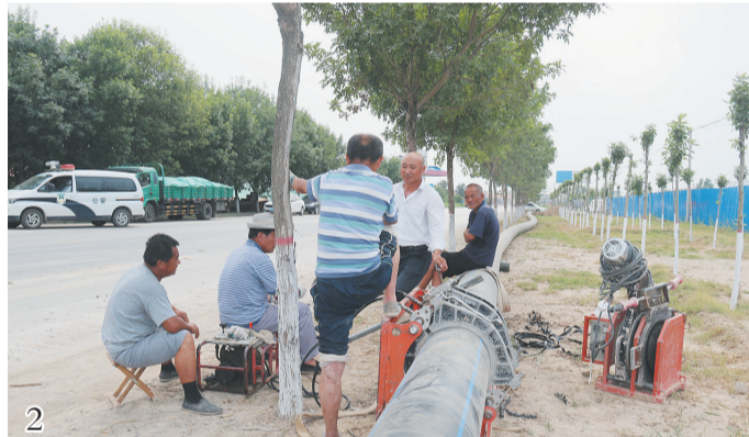
陈楼工贸园区自来水增容工程施工现场,为园区企业生产、生活创造了良好环境。

抢抓陈楼绿色皮革产业园区被县委纳入“五城同建、五区并进”“五五战略”的大好机遇,大力实施园区基础设施提升改造工程。投资500余万元完成了自来水增容工程,铺设自来水专线直达园区,解决了园区企业生产和生活用水难问题。投资450余万元完成了园区硬化、绿化、美化工程,安装了路灯和智能监控系统,新建及拓宽道路3.5公里,实现了园区内环贯通。投资550万元完成了园区电网配套工程,提升改造园区线路5条,为园区企业发展提供了强有力的电力保障。