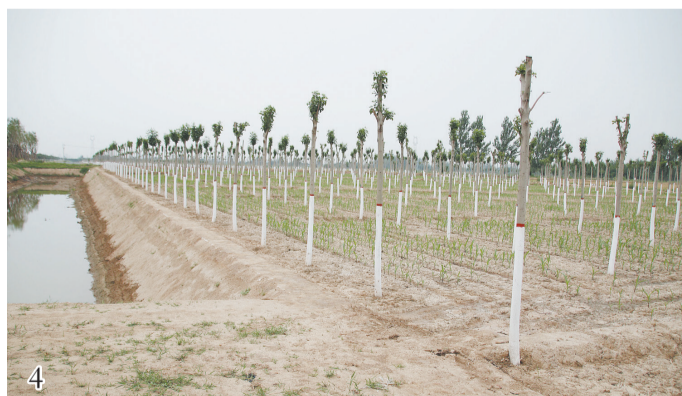
阳信县林业生产示范段——滨阳大道绿色林带建设劳店段。

扎实开展全域环境综合整治活动,城乡人居环境和群众生活质量得到有力提升。以提升群众幸福指数为目标,完成了南潘、宋集等9个提档升级村,西王、小代等8个巩固提高村及市级示范村小刘村的美丽乡村建设任务。把林水会战作为实施乡村振兴战略的重要基础和载体,上半年完成植树造林4700余亩,疏浚治理灌溉沟渠15条,新建小农水工程4000余亩,圆满完成林水会战任务;滨阳大道绿色林带建设劳店段,代表全县接受了全市林水会战观摩,受到一致好评。