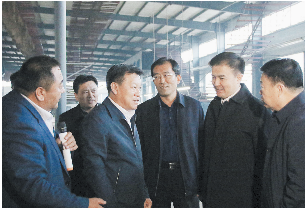
2018年11月26日,市委书记、市人大常委会主任张光峰到阳信县劳店镇视察工作。

岁月不居,时节如流。2018年对阳信县劳店镇来说,是极不平凡、浓墨重彩、创造辉煌的一年。一年来,在县委、县政府的坚强领导下,劳店镇党委、政府认真学习贯彻习近平新时代中国特色社会主义思想,紧紧围绕建设工业强镇和打造绿色皮业小镇的目标,深入践行新发展理念,克服经济下行压力和环保压力,担当作为、砥砺奋进,全镇经济社会实现又好又快发展,呈现出风清气正、人心思上、干事创业、和谐稳定的良好局面。2018年,劳店镇预计实现一般公共预算收入4800万元,同比增长9.0%,位列全县第三位;完成固定资产投资14.1亿元,同比增长40%。