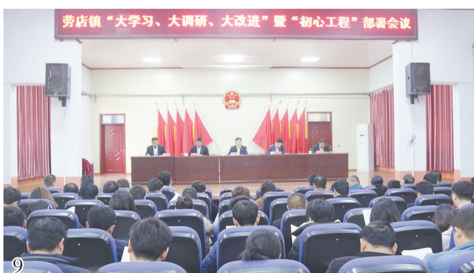
注重加强党员干部学习培训,努力打造忠诚干净担当的高素质干部队伍。

镇党委、政府坚持把教育放在优先发展的位置,倡导一切工作为教学服务,努力提升全镇教学质量,教育事业再续辉煌。2018年中考,该镇上线人数、上线率,再次获得全县乡镇第一名的好成绩。不断加大教育投入,狠抓教育基础设施建设,努力提升办学条件,镇中心小学校区建设稳步推进,投资475万元完成了项目前期设计勘察、土方工程、变压器、混凝土空心桩等建设,出资340万元迁移了劳水线、果刘线高压变电线路,新建大桥1座。