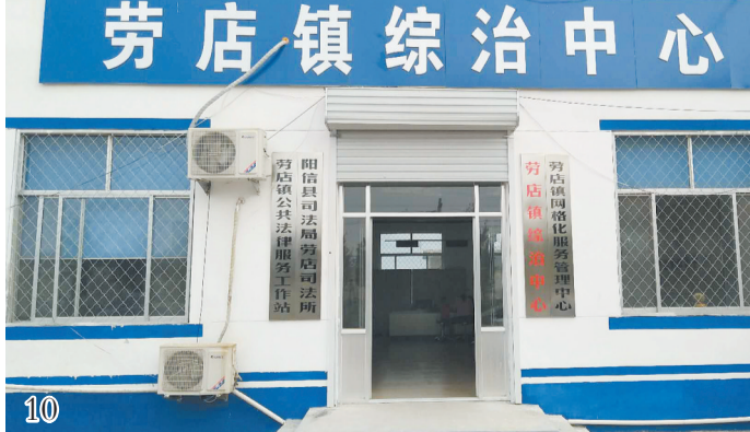
劳店镇综治中心建成并投入使用,为打造共建共治共享的社会治理格局提供了有力保障。

深入开展“平安劳店”创建活动,强化普法和综治阵地建设,全镇86个村全部建成司法行政工作室;镇综治中心建成并投入使用,基层社会治理能力和公共服务管理水平得到提高。推动扫黑除恶专项斗争不断向纵深发展,人民群众安全感和满意度显著提升。建立了镇领导班子成员轮流值班接访制度、首访责任制度和包案制度,加大信访矛盾纠纷排查化解力度,努力把各种矛盾和问题解决在基层、化解在萌芽,确保社会大局稳定。