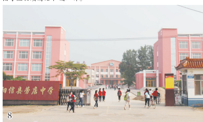
办学条件优越、设施完善,不断开拓进取、追求卓越的劳店镇中学。

坚持以人民为中心的发展思想,解决好群众最关心、最直接、最现实的利益问题。扎实推进“四好农村路”建设,完成了前周、东王、荀河、镇中学等路段25公里的公路修建任务,改善了群众的交通和出行条件。完成了129户的危房改造任务,妥善解决了贫困群众的住房问题。投资300余万元,在阳劳路、镇中小学路、陈楼工贸园区道路等重点路段,安装路灯450余盏,方便了群众、学生夜间出行。在2017年完成26个村“煤改气”“煤改电”的基础上,2018年又积极响应上级号召,完成生物质清洁取暖工作,全镇9个村1132户群众用上低碳环保、生态循环、经济安全的新能源取暖。