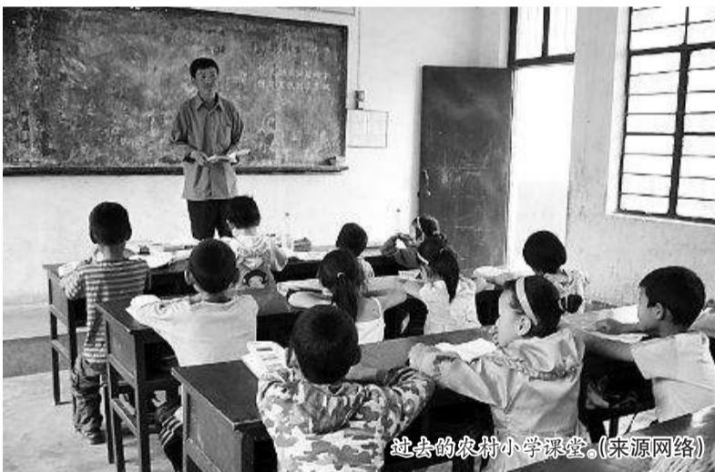
逝去的农村小学课堂。(来源网络)

当时,比我小两岁的弟弟也已读五年级,爷爷生病,一家人的生计仅靠父母勉强支撑。每到交学费的时候,