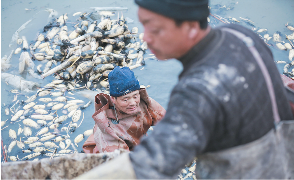
黑泥、白藕、皮裤、冰水……寒风中,挖藕人从池中挖出大量鲜藕。

小开河引黄灌区地处黄河三角洲腹地,纵贯滨州市七个县区,是国家大型引黄灌区之一,担负着城乡生活、农业灌溉、工业生产等重任,是滨州市的重要水源,2017年12月被国家林业局评为国家级湿地公园。