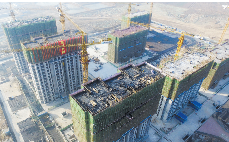
白鹭水岸项目工程主体结构顺利封顶。