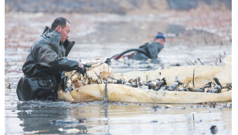
挖藕工小心地劳作,一节节白胖的莲藕不断浮出水面。