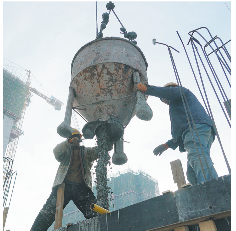
工程建设采用剪力墙结构,工人严谨施工,确保建筑质量。