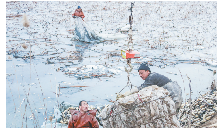
岸边,专人负责用称重的吊车盘点收获。