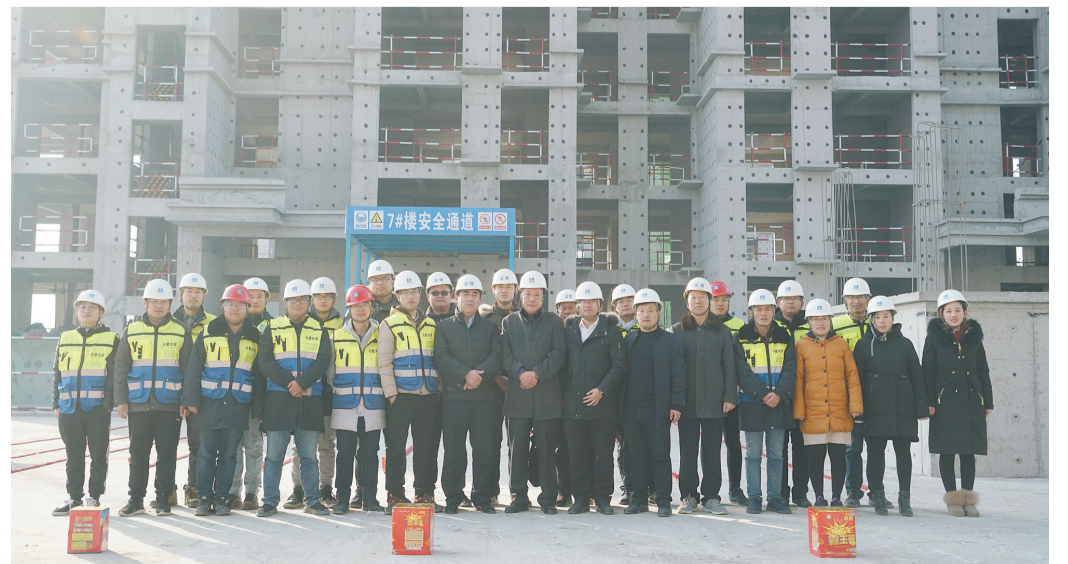
工作人员发扬“超英精神”,紧密协作、攻坚克难,圆满完成既定目标。