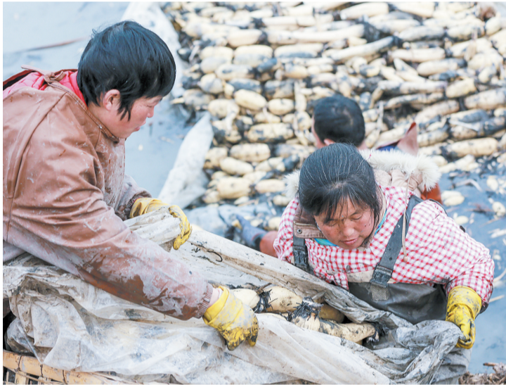
女工主要负责清洗莲藕,摆放整齐,避免折断。