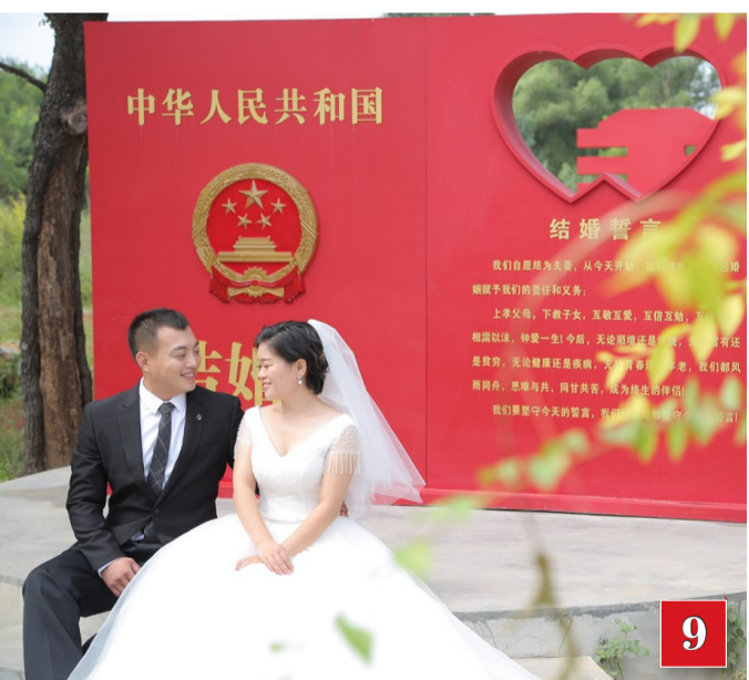
全市首个以移风易俗为主题的福彩婚庆公园落成,倡树婚姻文明新风尚。