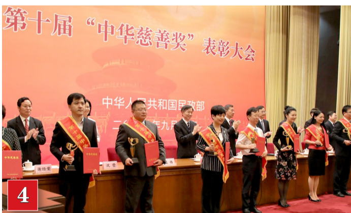
9月13日,滨州市村居互助基金救助项目荣获中国政府最高慈善奖项“中华慈善奖”。