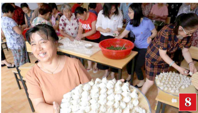
康家堡的老人们在孝善食堂包饺子。2018年,我市积极探索试点“孝善食堂”、“积分养老”农村养老关爱服务新模式。