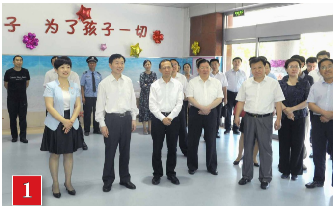
2018年5月31日,民政部党组书记、部长黄树贤在市委书记、市人大常委会主任张光峰的陪同下,调研视察我市民政工作。

半年多来,该保险已累计立案2158起,赔付保险救助金791.28万元,对因居家意外、自然灾害等五类原因造成的人身伤亡和财产损失予以救助,有效增强了政府和家庭对居家意外等风险的抵御能力。