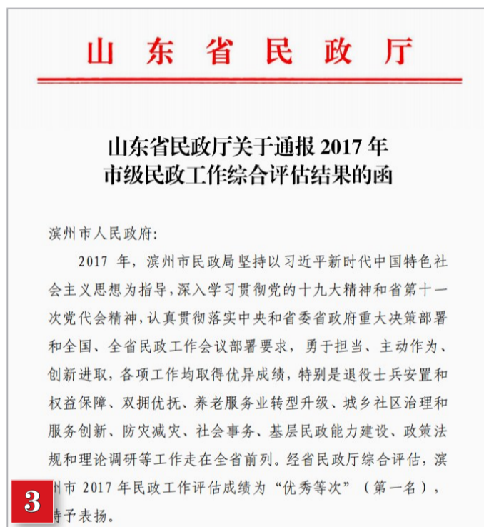
市民政局连续四年在全省民政综合评估中位居第一名,荣膺“四连冠”。