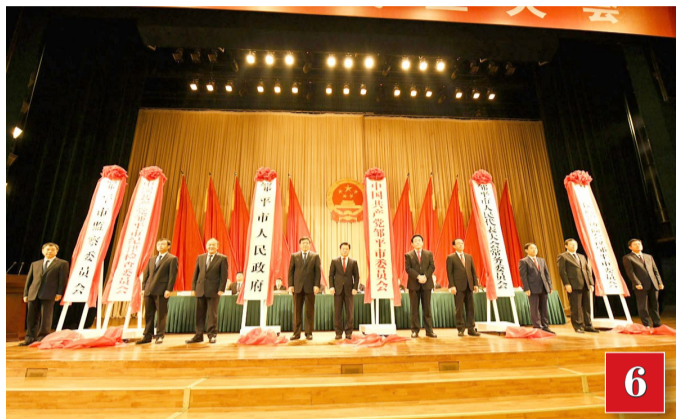
2018年10月26日,邹平市成立大会隆重举行。