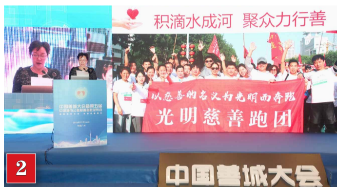
2018年11月5日,在中国善城大会暨第五届中国城市慈善指数发布会上,副市长长青做主题发言。