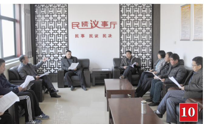
沾化区富国街道富国社区设立民情议事厅,开展社区事务协商活动。