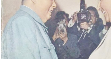
笔者收藏的这本品相完好的1952年第11期(总第41期)《大众电影》

影(苏联影片展览专辑)虽不算极品,但在收藏家所说的1950—1954年那93期珍品之列。现在,一股《大众电影》收藏热正在悄然兴起。一大批藏家正在四处寻觅“文革”前出版的三百零六期《大众电影》。因为这些老杂志历经数十年风风雨雨,烧撕损耗,目前存世的已寥若晨星。物以稀为贵。更何况这些老杂志还承载着很多读者、影迷对已逝年华一些情愫、场景的追忆、回味。