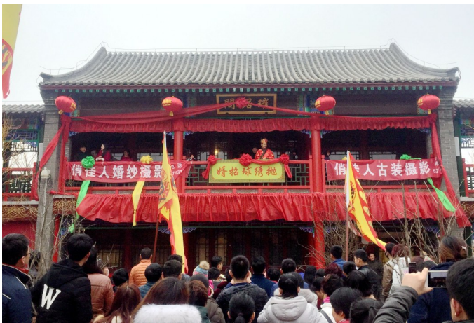
武定府衙景区“郡主”抛绣球表演。