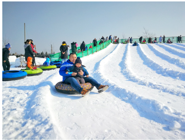
在孙子兵法城畅快滑雪。