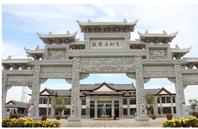
魏集古村落将举办新春花灯庙会。