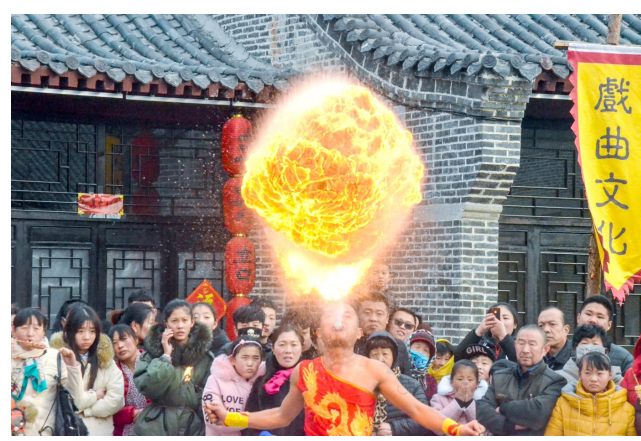
吐火表演引来众人围观。