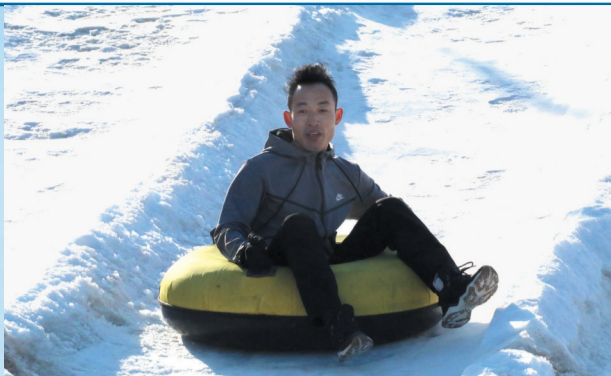
雪地闯关项目让运动员们体验了一把速降的风驰电掣。