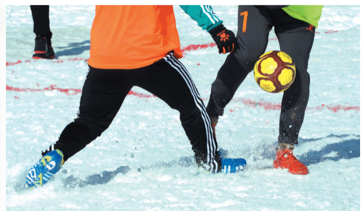
雪花与足球一起在地面飞舞,让观众们欣赏到另一种竞技之美。