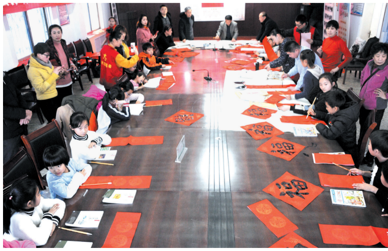
书法爱好者和第六小学的孩子将新春欢乐和满满祝福书写进一副副飘着墨香的春联。