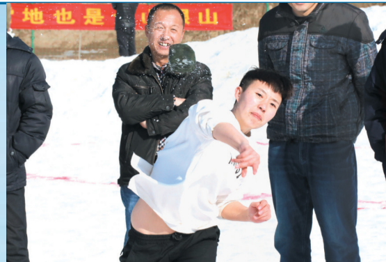
掷沙包比赛让不少人回忆起了童年。