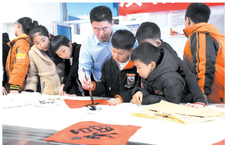
书法爱好者指导孩子们书写福字和春联。