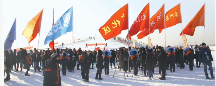
开幕式现场红旗招展,与雪地形成鲜明对比。

赛事期间,运动员们一边比赛,一边将欢乐的瞬间上传至“朋友圈”,让七星小镇刷了屏,当了一把“网红”。据了解,七星小镇除了滑雪场,还有游泳馆、足球场、跑马场、体育拓展、温泉会议、亲子采摘等项目及配套设施。项目使体育产业、文化、旅游三元素有机结合,成为具有山水特色的“户外运动赛事集散地、山地训练理想地、体育文化展示地、体育用品研发地、旅游休闲必经地和富裕民众宜居地”。