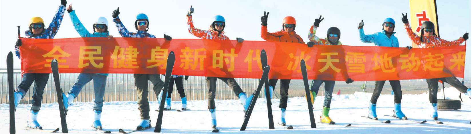
位于阳信县水落坡镇的东山雪场打出“全民健身新时代,冰天雪地动起来”的口号。