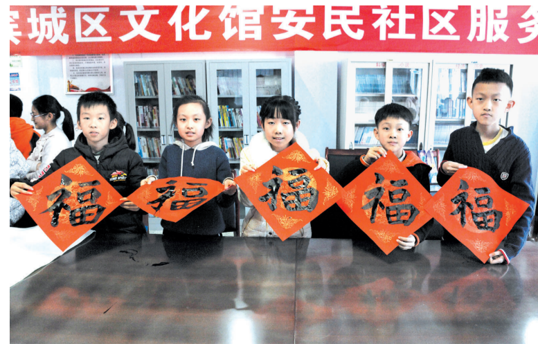
书写着祝福,传承着传统。