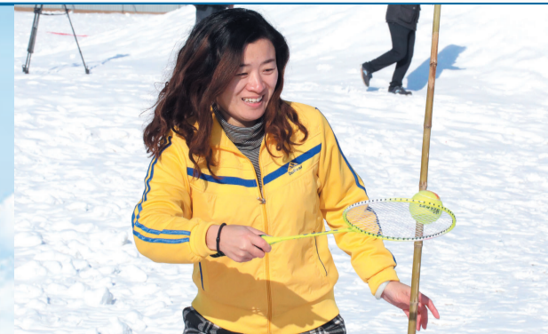
托球跑绕杆返回的时候最能体现“人球合一”。