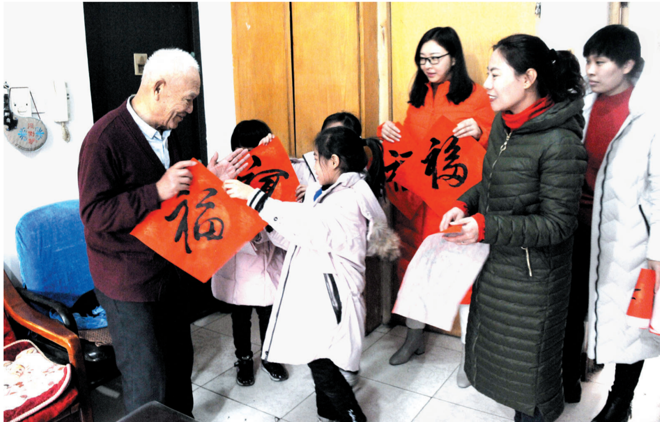
满满的祝福送给社区居民。

共驻共建单位滨城区第六小学,也组织放假在家的小学生以志愿者的身份赶了过来。小志愿者们听大志愿者讲春节贴春联、贴福字的春节习俗,并在大志愿者们指导下,用稚嫩的小手学着书写起春联。通过听故事、写春联,小学生们对书法艺术和春节文化有了更深了解。