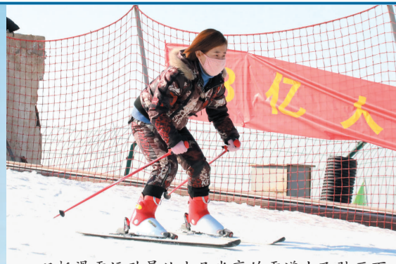
双板滑雪运动员从十几米高的雪道上飞驰而下,演绎雪上“速度与激情”。