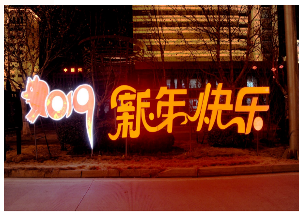
造型别致的灯饰烘托浓浓年味。