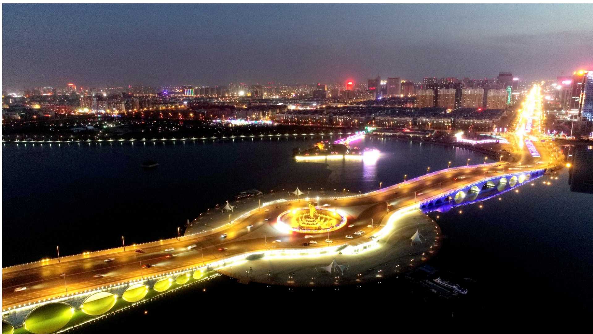
流光溢彩,大美滨州。