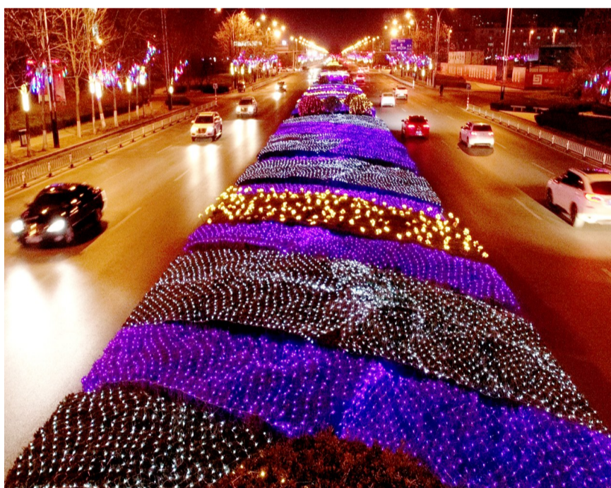
绿篱中各种造型灯饰亮眼。