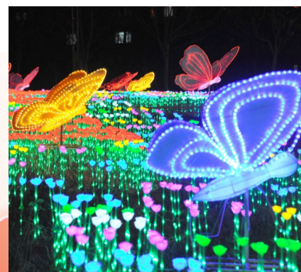
蝴蝶造型灯饰栩栩如生。