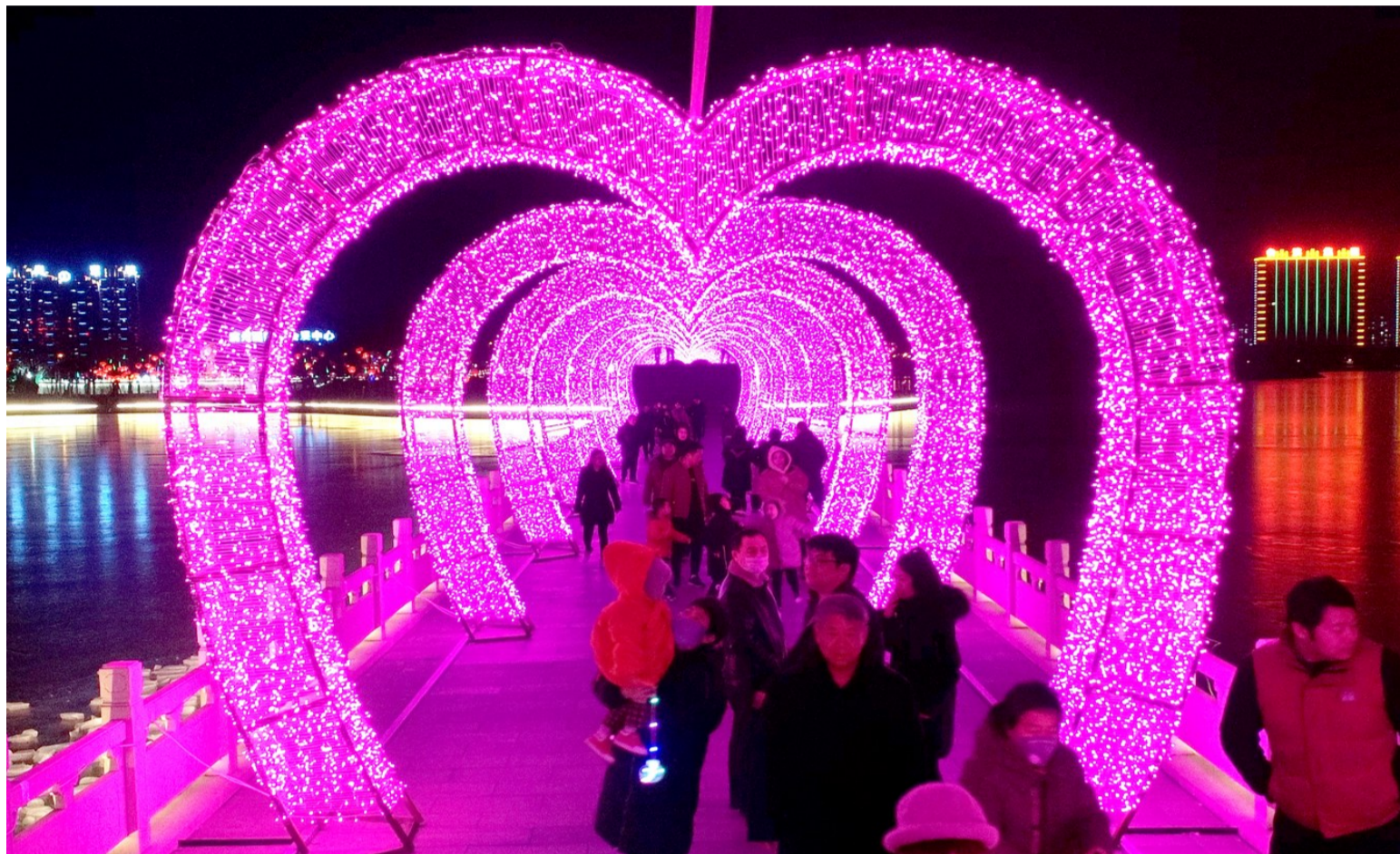
200米长的灯光隧道让人流连忘返。

品灯饰造型别致,看夜景流光溢彩。光影交织渲染中,年一天天近了,城区的夜更是一天天美了。