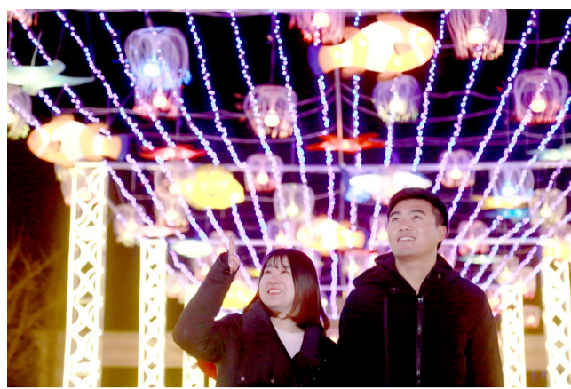
亮丽的街景引得市民驻足欣赏。