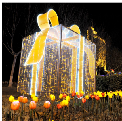
美丽灯饰惊艳亮相。