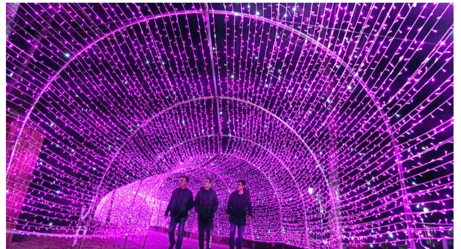
置身灯光长廊,仿佛走入童话世界。