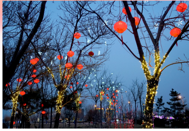
树上的红灯笼造型灯饰让年味更浓。