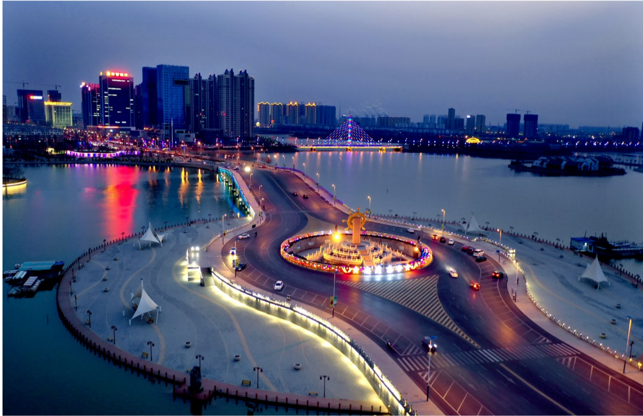
灯光璀璨的渤海十八路,如同一道流苏从中海延伸而去。