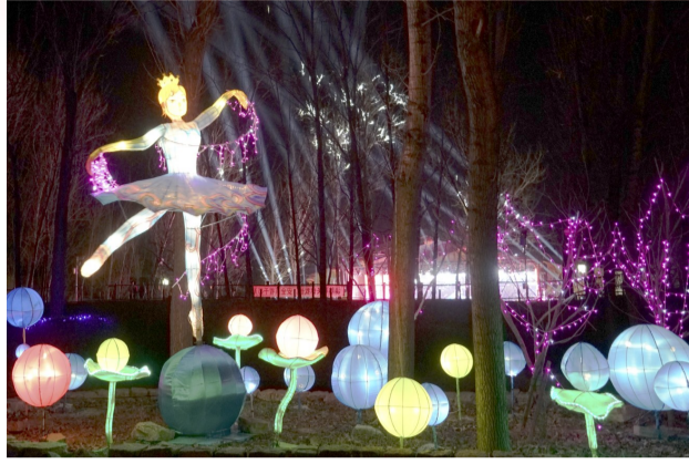
造型别致的灯饰俏皮可爱。

据介绍,春节期间,西纸坊·黄河古村的花灯主要有梦幻天鹅湖、福旺贺岁、说学逗唱、追忆童年、步步高升、龙凤呈祥、鸟语花香、虎头虎脑、中华国粹、年年有鱼、金猪报春、双龙戏珠、金猪送福、蜘蛛侠、鲤鱼跃龙门、飞龙在天、喜庆元宝、喜洋洋与灰太狼、新春快乐、舞动青春、金鸡啼鸣等20多个类型,让广大游客不虚此行。