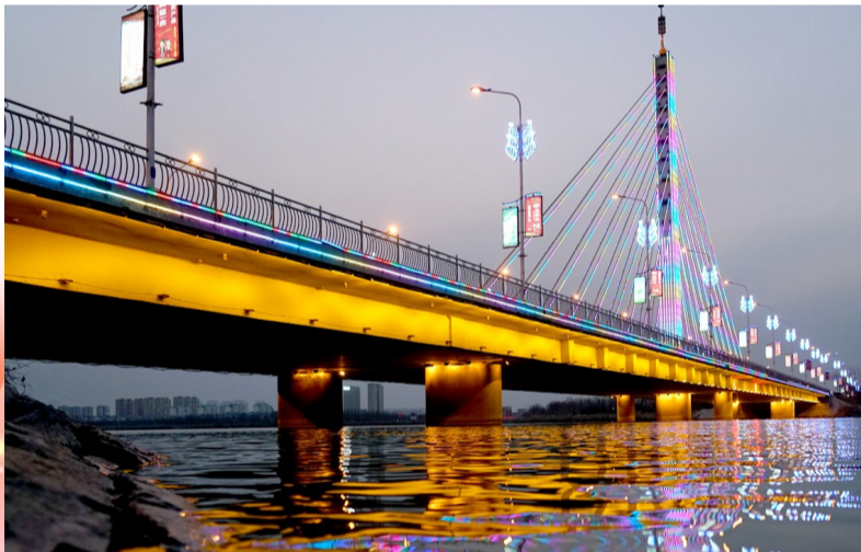
水波荡漾,映衬着炫彩灯光,仿佛桥梁也有了花衣裳。