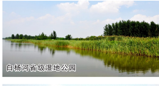
白杨河省级湿地公园