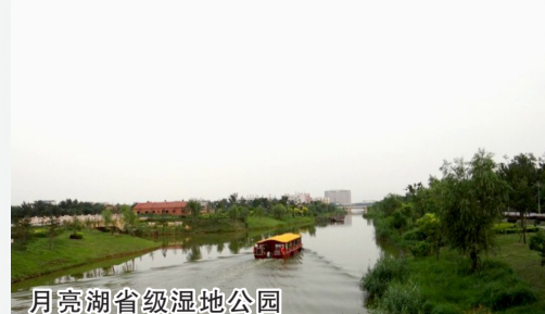
月亮湖省级湿地公园