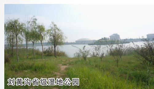
刘黄沟省级湿地公园