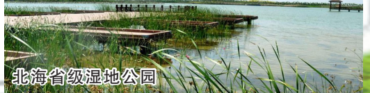
北海省级湿地公园