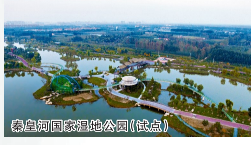
秦皇河国家湿地公园(试点)