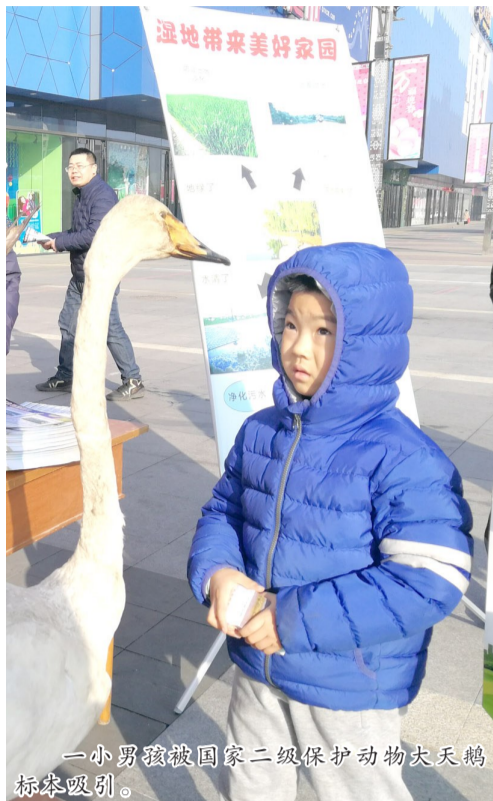
一小男孩被国家二级保护动物大天鹅标本吸引。