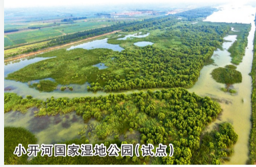
小开河国家湿地公园(试点)