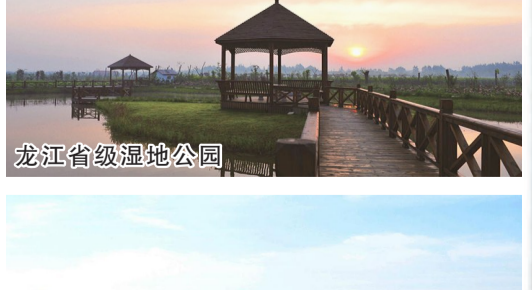
龙江省级湿地公园