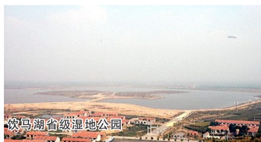
饮马湖省级湿地公园