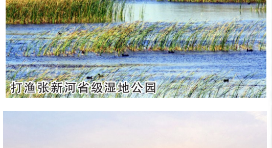
打渔张新河省级湿地公园