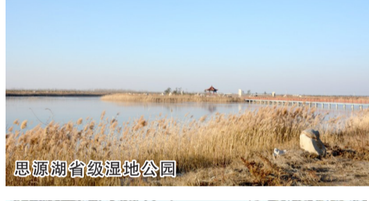
思源湖省级湿地公园