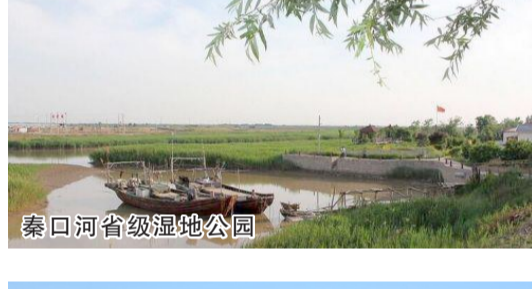
秦口河省级湿地公园