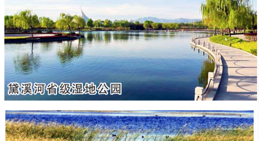
黛溪河省级湿地公园