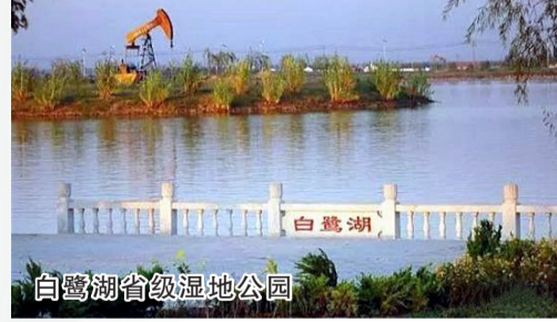
白鹭湖省级湿地公园