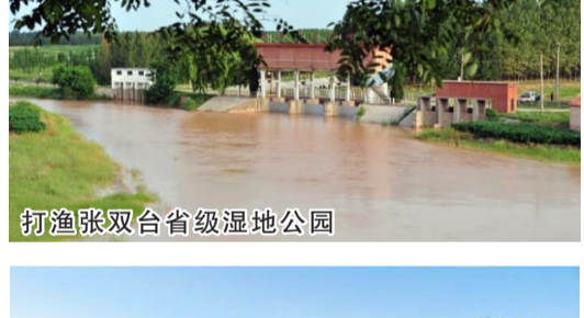
打渔张双台省级湿地公园