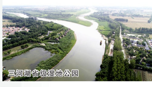
三河湖省级湿地公园