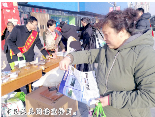
市民认真阅读宣传页。