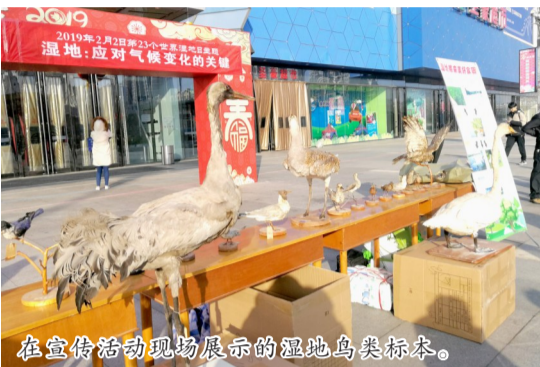
在宣传活动现场展示的湿地鸟类标本。