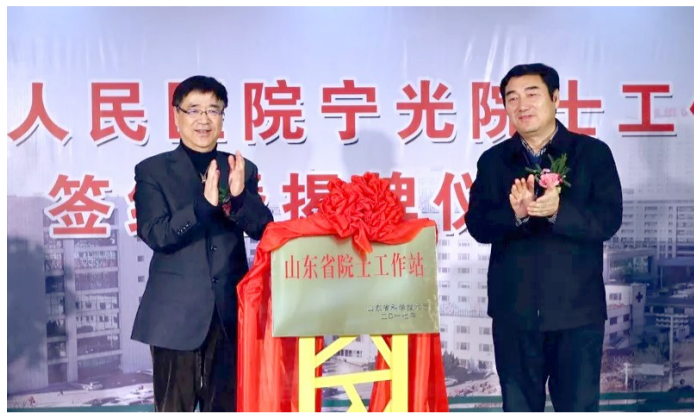
宁光院士(左)与滨州市市长(右)共同为院士工作站揭牌。

作为山东省优质护理示范工程省级重点联系医院，医院优质护理示范病房覆盖率达100%。同时，全力构建护理“三精一优”服务品牌，即精诚文化、精良培训、精益质控、优质服务；以“一科一特色、一病一品牌”为指引，推行省心服务及人性化全程服务，深入落实优质护理服务；依托护理门诊及杏林医管中心，开展延伸护理服务，造福一方百姓；落实前馈控制和反馈控制，完善护理安全预警机制，规范不良事件管理。在近三年