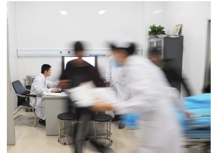
时间就是生命，忙碌的急诊室。