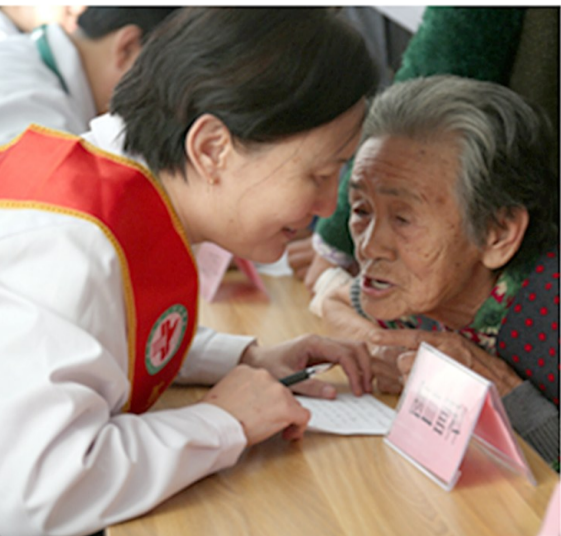
健康行志愿服务队一直在路上。

“三甲”医院复审顺利通过，是成绩更是鞭策。站在新的历史起点上，滨州市人民医院将继续坚守守人、技术、服务“三位一体”，不断引进专业人才、尖端设备，沿着“人民医院为人民”的道路继续前行，为群众提供全方位全周期的健康服务。