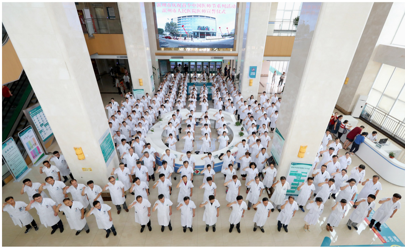
医师节宣誓：“敬佑生命，救死扶伤，甘于奉献，大爱无疆。”