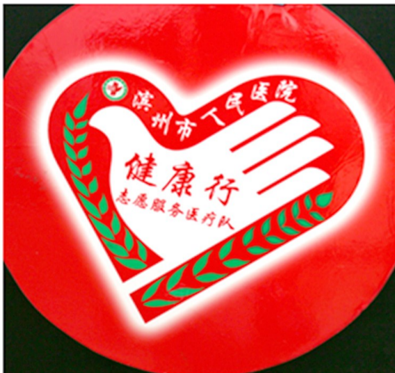
打造健康行志愿服务品牌。