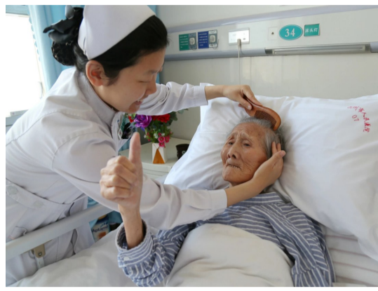
患者为医院化质护理服务点赞。