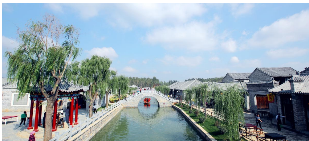
惠民县魏集古村落美景如画