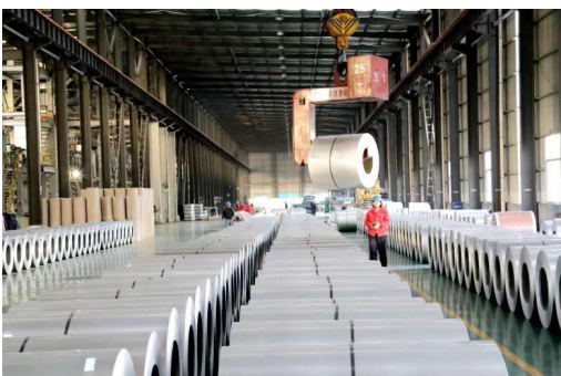
惠民县惠博新材料公司加班加点赶制订单