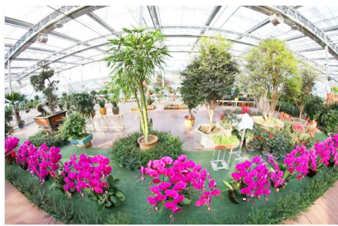
惠民县黄河三角洲花卉苗木展览中心繁花似锦