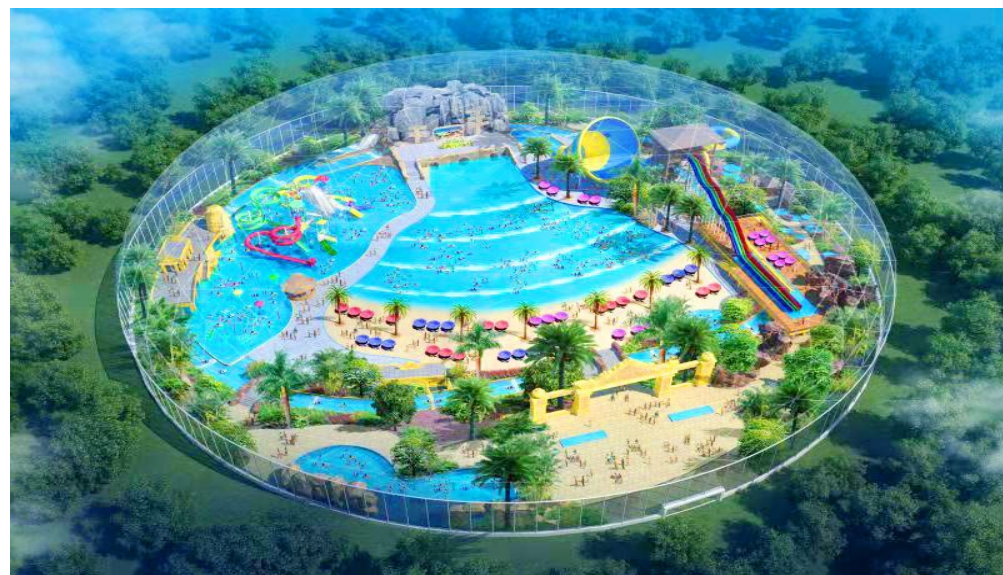
惠民县青少年素质教育与水上训练中心项目主体完工

好处。”正在皂户李镇康家堡村孝善食堂吃饭的康大爷逢人就夸党的政策好，让像他这样的老年人有了新去处。