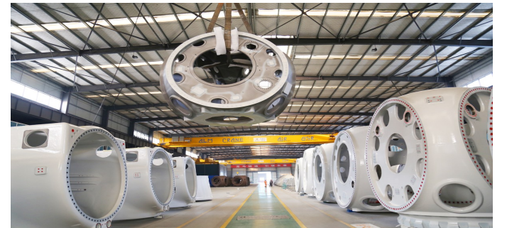
惠民县龙马重科车间