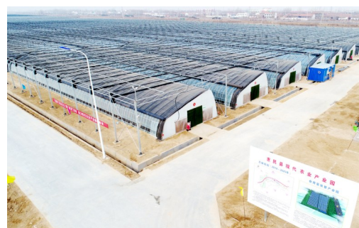
惠民县现代农业产业园食用菌扶贫产业园