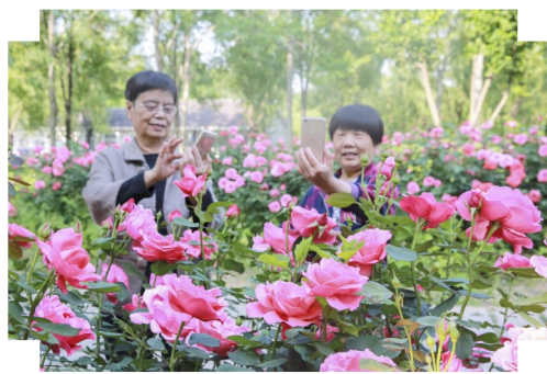
鲜花满城扮靓滨州。