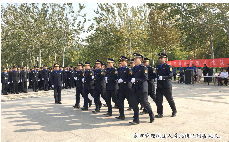
城市管理执法人员比拼队列展风采。

实施园林民生工程。 实施滨州植物园二期工程、新立河西岸(黄河二路至长江三路)路西绿化提升改造工程、新立河人防疏散点建设暨绿化改造提升工程、乒乓球馆前游园