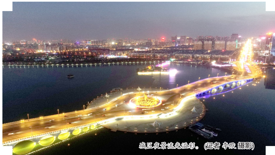
城区夜景流光溢彩。