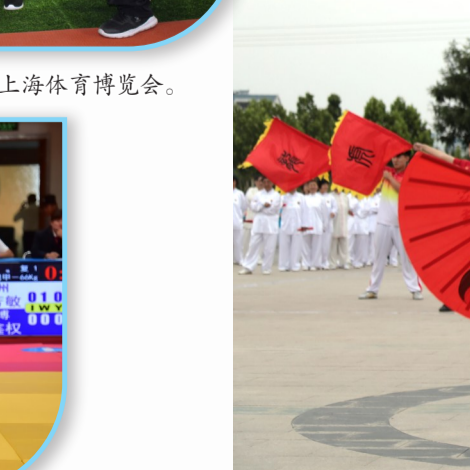
太极扇爱好者在健身广场进行传统武术表演。