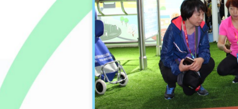
市体育局组织各县区观摩2018年上海体育博览会。

在体育产业示范创建和资金申报方面，滨州持续发力，目前，我市已创建省级体育产业示范基地1家(惠民李庄镇)，示范单位2家(山东鲁友体育产业有限公司和山东智轩体育科技有限公司)，示范项目1家(滨州市奥林匹克体育馆)。