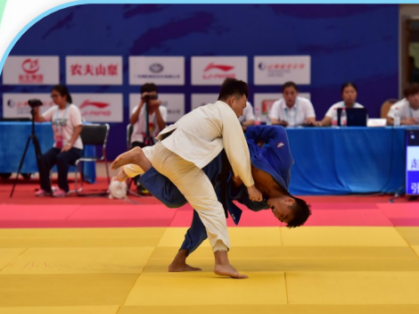
滨州运动员在第24届省运会决赛赛场上拼杀。