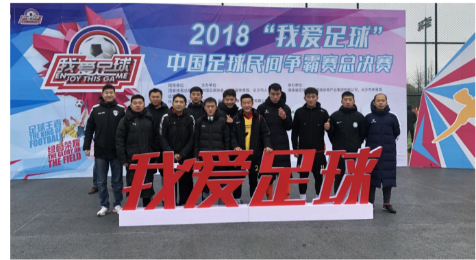
滨州足球队在“我爱足球”全国总决赛上获得第六名的历史最好成绩。

了展会。近年来，李庄的体育绳网甚至走出了国门，站在了全世界最高赛事的舞台上——2016年里约奥运会的足球网正是产自李庄，2022年北京冬奥会滑雪赛场的围网也将被李庄承包。滨州本地运动服饰品牌“尚尚运动”也在不断拓展市场，打造品牌影响力，目前已经在青岛、济南等地开设形象店，并连续参加北京时装周走秀，其设计的时尚感获得国内外专家高度评价。