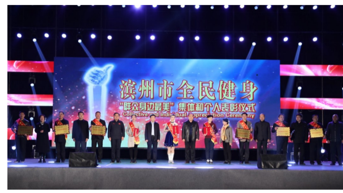
市体育局对“群众身边最美”系列活动的获奖个人、单位进行表彰。