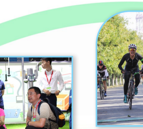
第二届“沿黄去码头”全国自行车精英赛吸引490余名运动员参赛。

2018年5月，第36届上海国际体育用品博览会和中国(山东)品牌产品中东欧展览会先后举行，我市组织体育产业相关企业参加