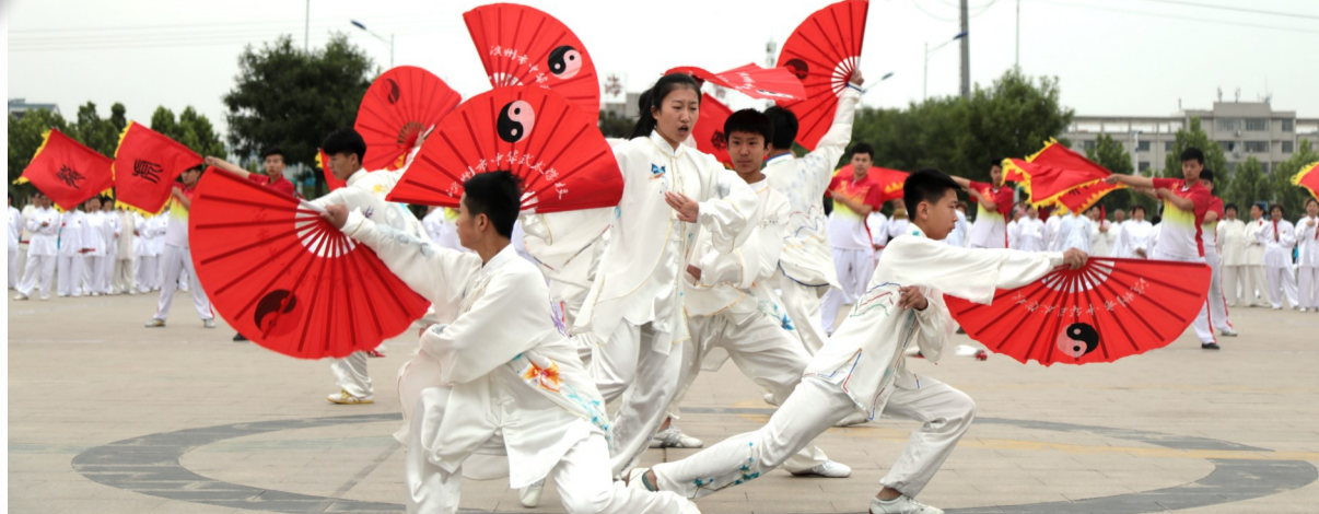
太极扇爱好者在健身广场进行传统武术表演。