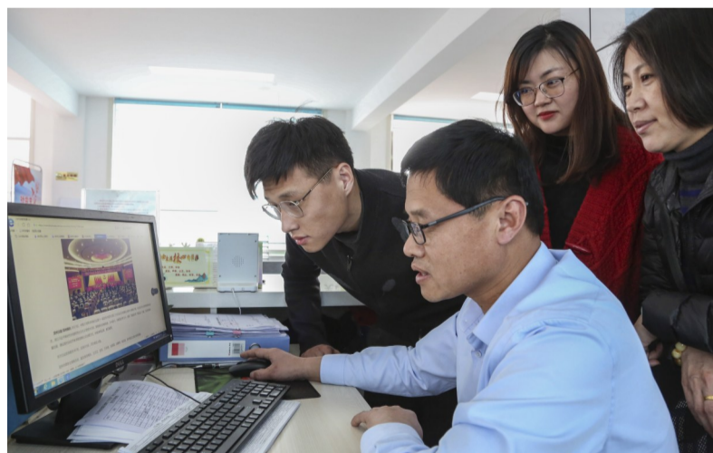
滨城区彭李街道苑社区工作人员通过滨州网了解“两会”相关新闻。

提案工作报告、市人民检察院工作报告、市中级人民法院工作报告等都相继推出“扫码”看报告的功能。“扫码”之后,人们看到的是融合图表、图形、数字等形式,浓缩报告精华的一张