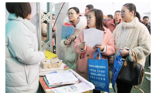
2019年博兴举行“春风行动”招聘会。