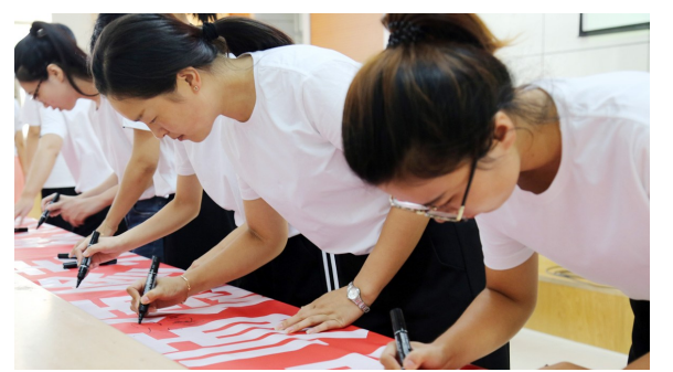
2018年8月，博兴县举行新入职教师培训会，152名新入职教师集体宣誓加入教师队伍，并进行了“加强师德师风修养，规范教育行为，做四有好教师”入职签名仪式。