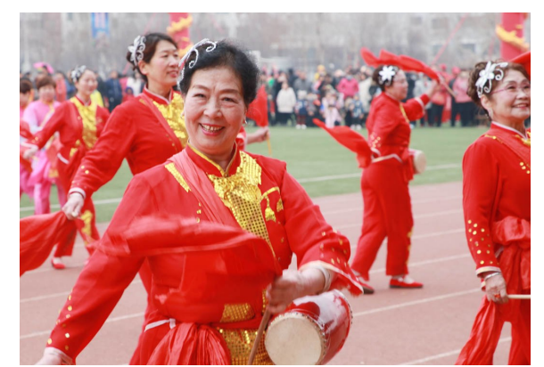
敲起来，舞起来，美好的日子乐起来。