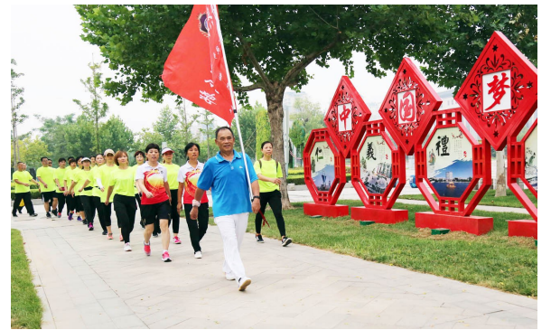
2018年“全民健身日”，博兴县群众通过参加健步走、骑行、太极剑、游泳、健身操等丰富多彩的健身活动，一起快乐“动”起来。