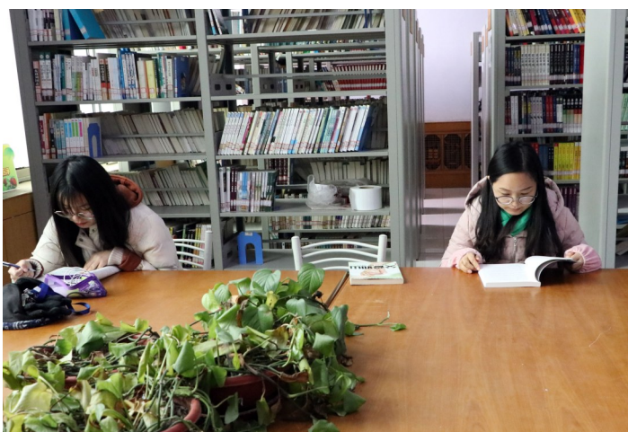
春节假期期间，博兴县图书馆迎来了大量读者，他们在这里阅读自己喜爱的图书期刊，在“书香”中度过一个有意义的假期。