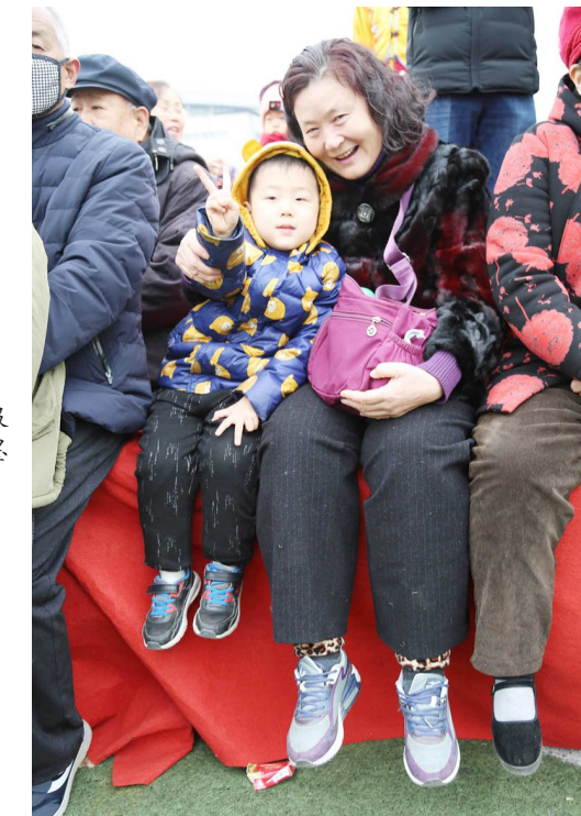
节目真好看，我来点个赞。