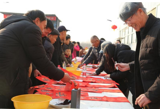
博兴图书馆、文化馆进行迎新春文化志愿服务，为过往群众送书送福送对联，书香唤醒春意，墨迹传递祝福。