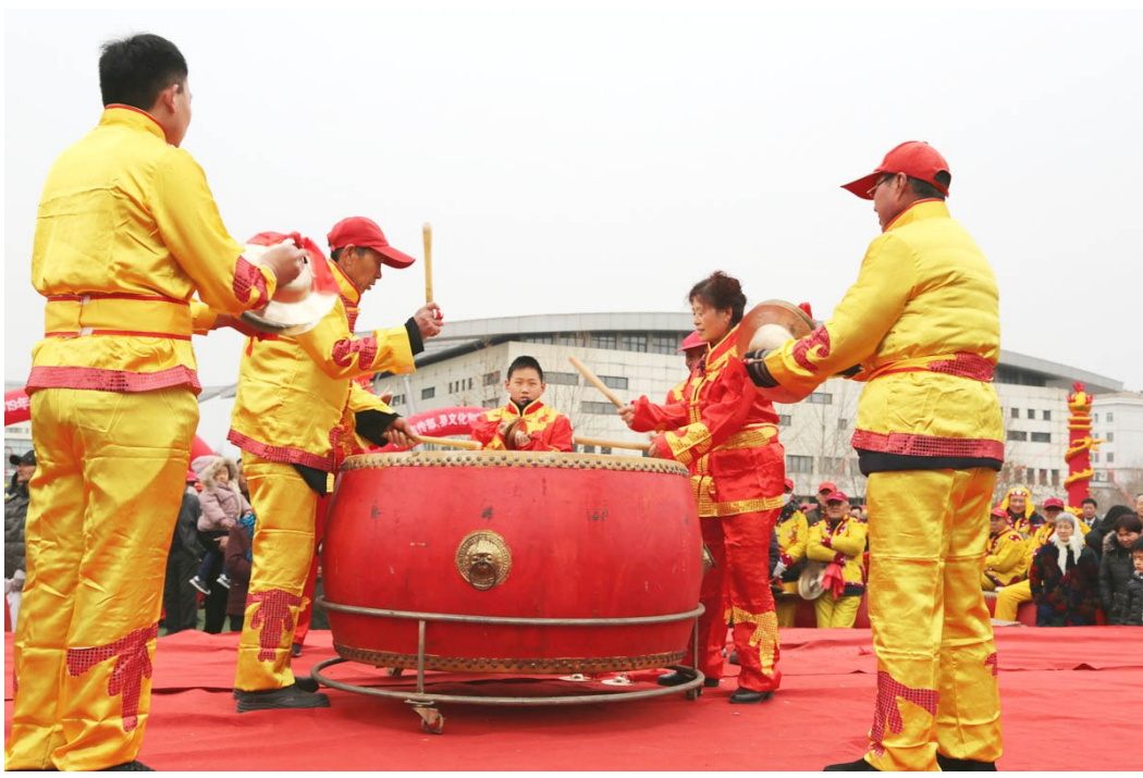
欢快的锣鼓鼓起来。

让节庆假日成为传统文化继承发扬的生动现场。对传统文化的继承和发扬，最好的方式就是让它回到民众之中。博兴县抓住春节这一佳节良时，通过民俗展演、锣鼓大赛、书画展、百姓节、猜灯谜看花灯等多种形式，体现优秀传统文化，呈现独特民俗。各镇、街道以村(社区)为单位也组织丰富多彩的文化活动。据统计，博兴全县共有100多场村级单位组织的文化活动，一场场欢快喜庆、农民自办的节目传递出新时代乡村群众的文化自信自觉、向善向美的精神风貌，弘扬了新时代的正能量，推动了乡村精神文明建设。