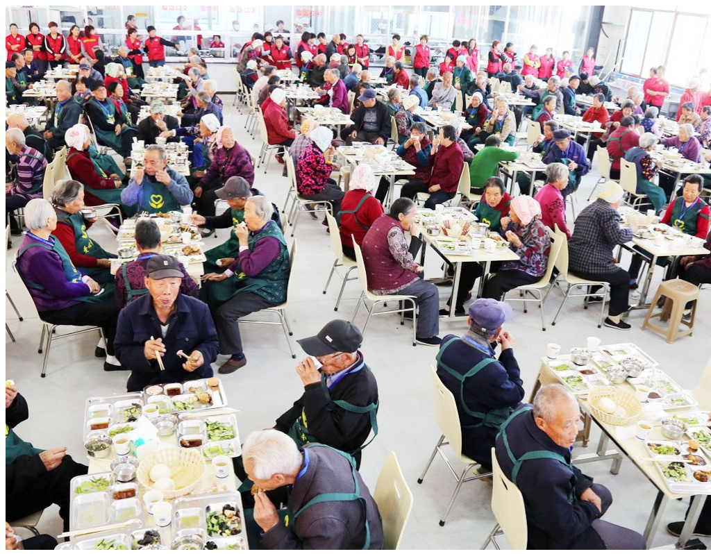
2018年10月17日，在博兴县湖滨镇寨卢村爱心食堂，老人们正在享用免费午餐。