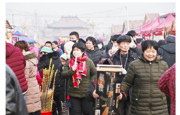
博兴县湖滨镇丈八佛庙会正月初八击鼓开锣，盛大亮相，兴国寺前门庭若市。