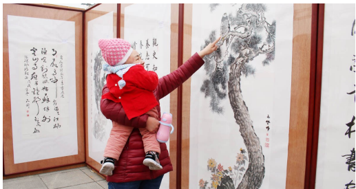
蒲姑文化寨下村举行第四届书画展。