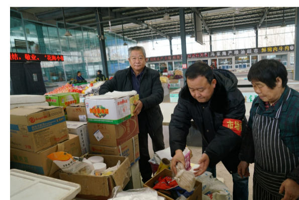
管理员帮助商户整理物品。