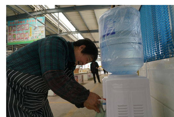
设置饮水机,服务更周到。