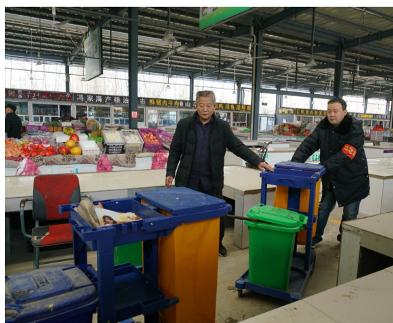
及时清扫卫生确保环境整洁。