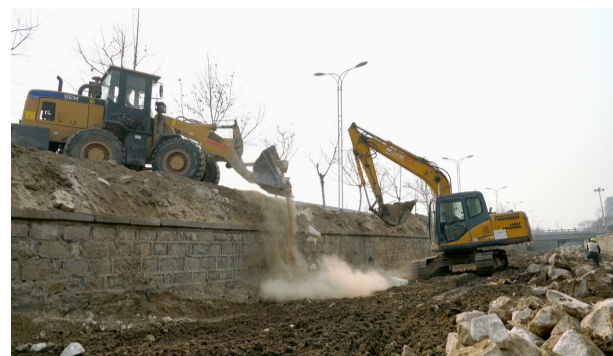
机械施工提升工程效率。