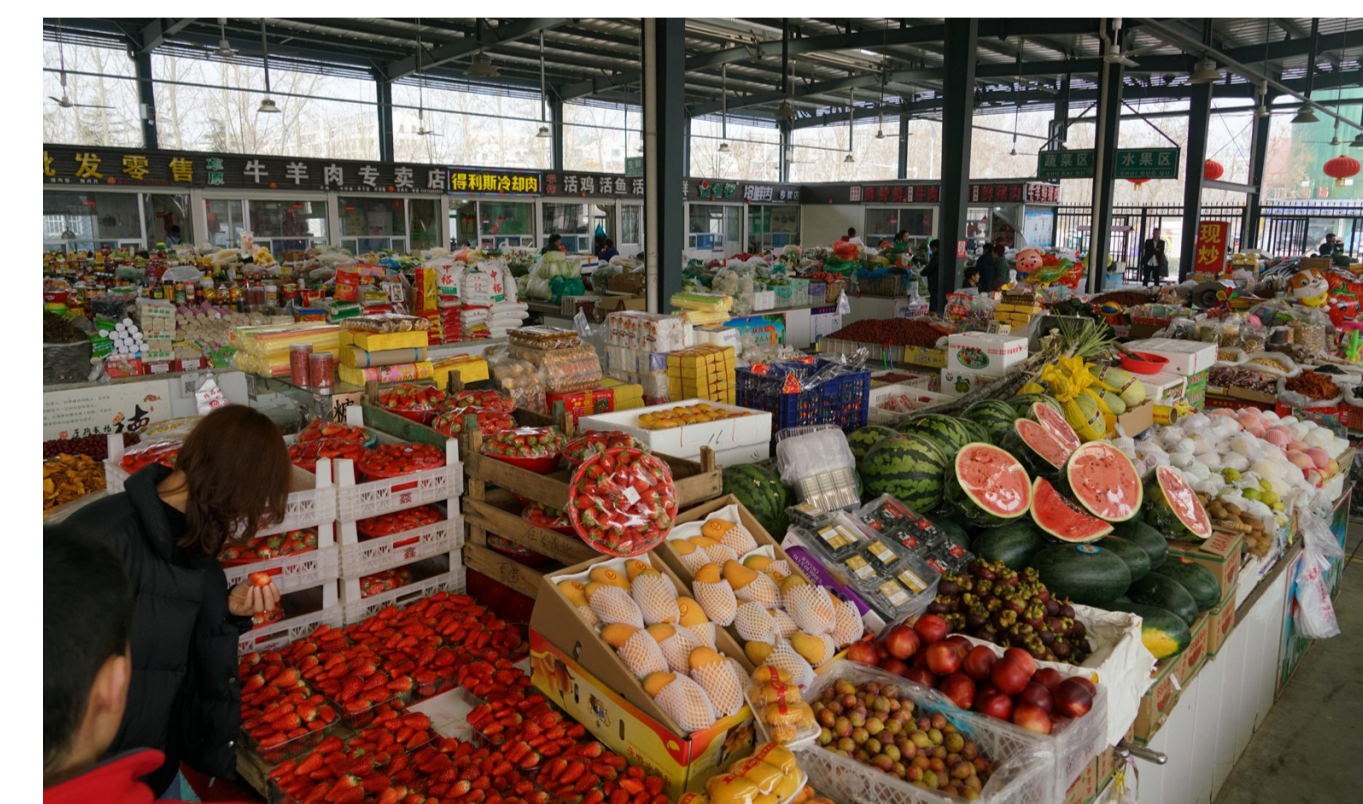
整治后的马坊市场更加整洁有序。

协管员,并统一购置了冷柜,实现所有熟食全部入柜。在市场的重点位置设置了专门的检测室,果蔬等食材的来源地信息也都明确写在柜台上,让顾客随时可追溯。同时,设置了便民柜台,供残疾人、贫困户自主择业。对小孩、老人的安全也考虑在内,市场的墙壁上贴上了泡沫板,即便摔倒磕碰到也不会造成红肿。