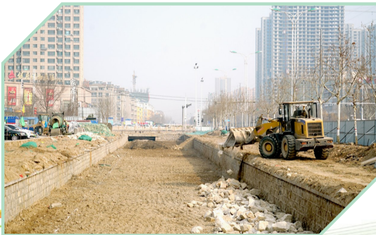
采用机械对两岸进行平整。