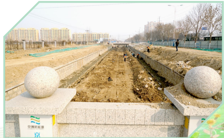
整治后的河道“颜值”聚增。