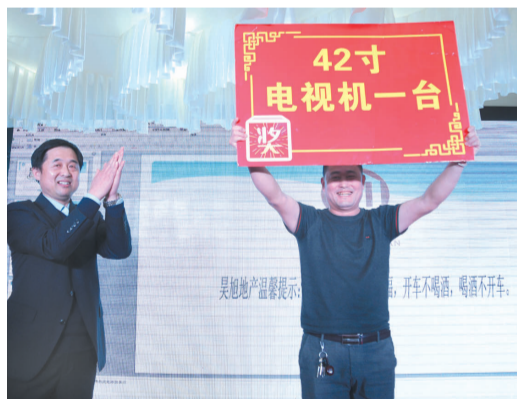
抽到一等奖的幸运嘉宾同时获得了海阳两日游和购房代金券。