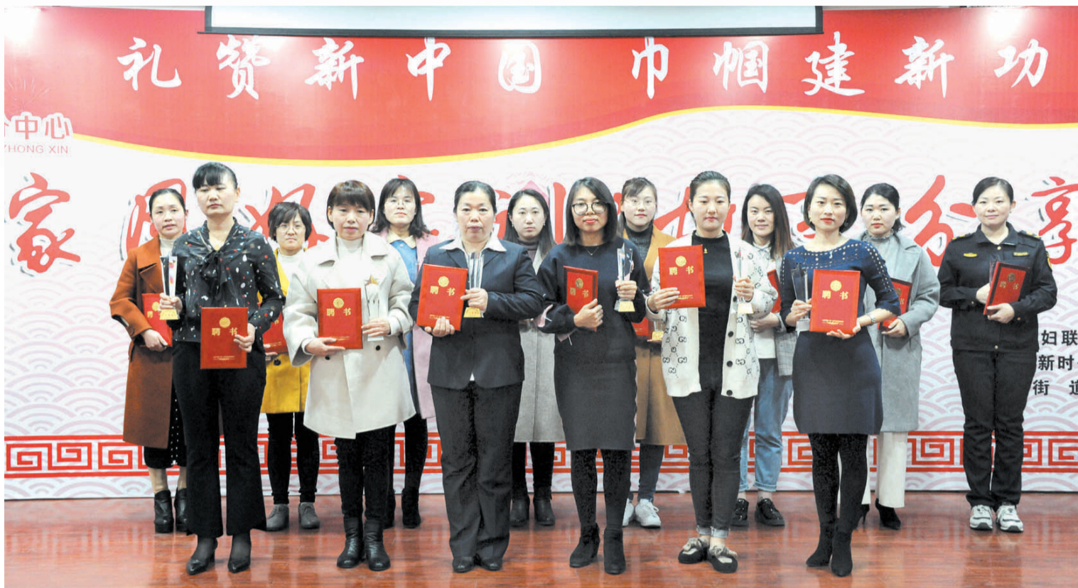
街道聘请14名故事分享人为北镇街道新时代文明实践分中心特约宣讲员。

为进一步推动新时代文明实践工作落地开花,倡导和培育优良家风,引导广大家庭树立崇德向善、见贤思齐的良好风尚,近日,滨城区北镇街道开展“礼赞新中国·巾帼建新功——好家风好家训”故事分享会。本次活动由北镇街道妇联、总工会、团工委、北镇街道新时代文明实践分中心、春晓社区联合举办。