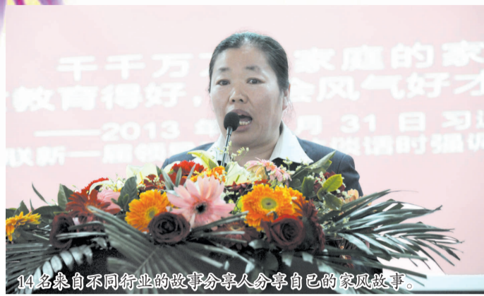
14名来自不同行业的故事分享人分享自己的家风故事。