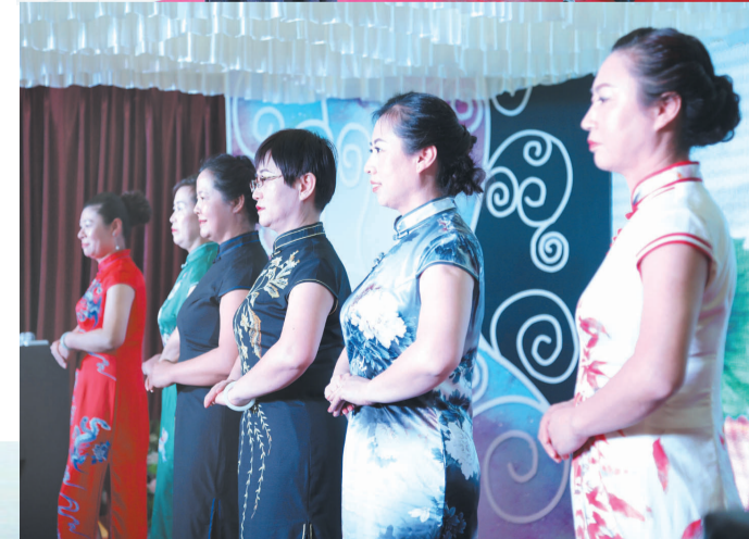
现场节目异彩纷呈。

3月9日晚,滨州日报和昊旭房地产营销策划有限公司联合举办海阳海景房品鉴会,邀请滨州社会各界人士畅叙友情,领略海阳风情、品味海景房魅力。