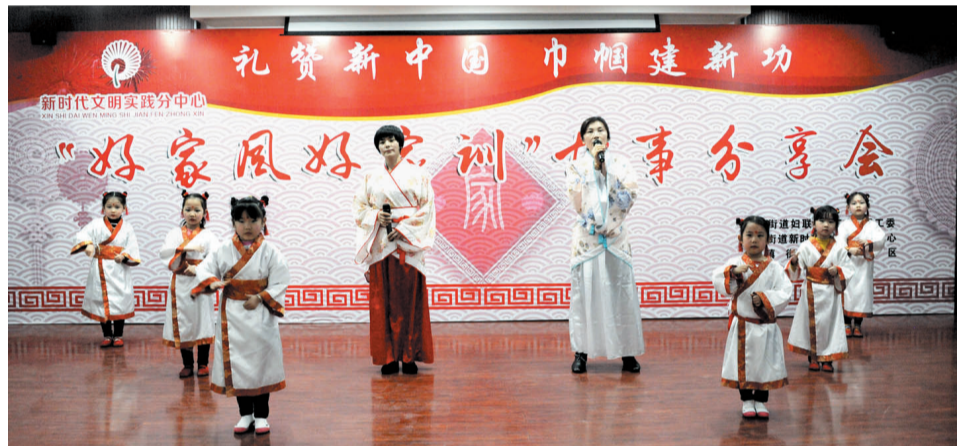
故事分享会在《四德歌》中拉开帷幕。

活动在《四德歌》中拉开帷幕,14位来自北镇辖区各行各业的故事分享人以自己的亲身经历声情并茂地向观众们分享了各自的家风家训主题故事。一段段真情的表达,展现了一个个家庭鲜明的道德风貌;一个个平凡家庭的故事,汇聚成一股股正能量,引发了现场观众的强烈共鸣。活动共评选出一等奖1名,二等奖2名,三等奖3名,纪念奖8名。同时,街道诚聘14位优秀故事分享人为北镇街道新时代文明实践分中心特约宣讲员,并为他们颁发了聘书。好家训带出好家风,好家风培育好儿女,好儿女建设好家园。本次活动通过传承家风家训好故事,传递了向上向善正能量,让讲家训、重家风成为社会风尚、家庭自觉,让新时代文明实践的新风吹入千万家。