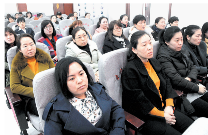
观众们投入地聆听着家风家训故事。