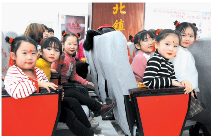
助演的小伙伴们接受家风家训故事的熏陶。