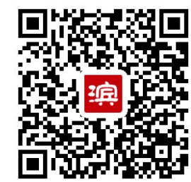
扫码聆听滨州城市主题曲《滨州我的家》

建峰担任主唱,和他的小沙与乐队现场演唱了这首歌。发布会现场,同时举办了滨州保利大剧院儿童艺术团童声合唱团成立仪式。