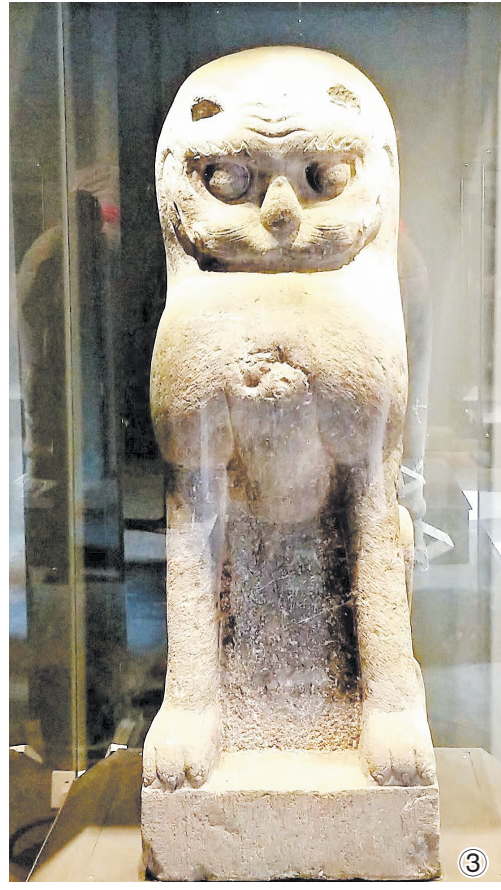
③吴式芬墓地出土的镇墓兽。