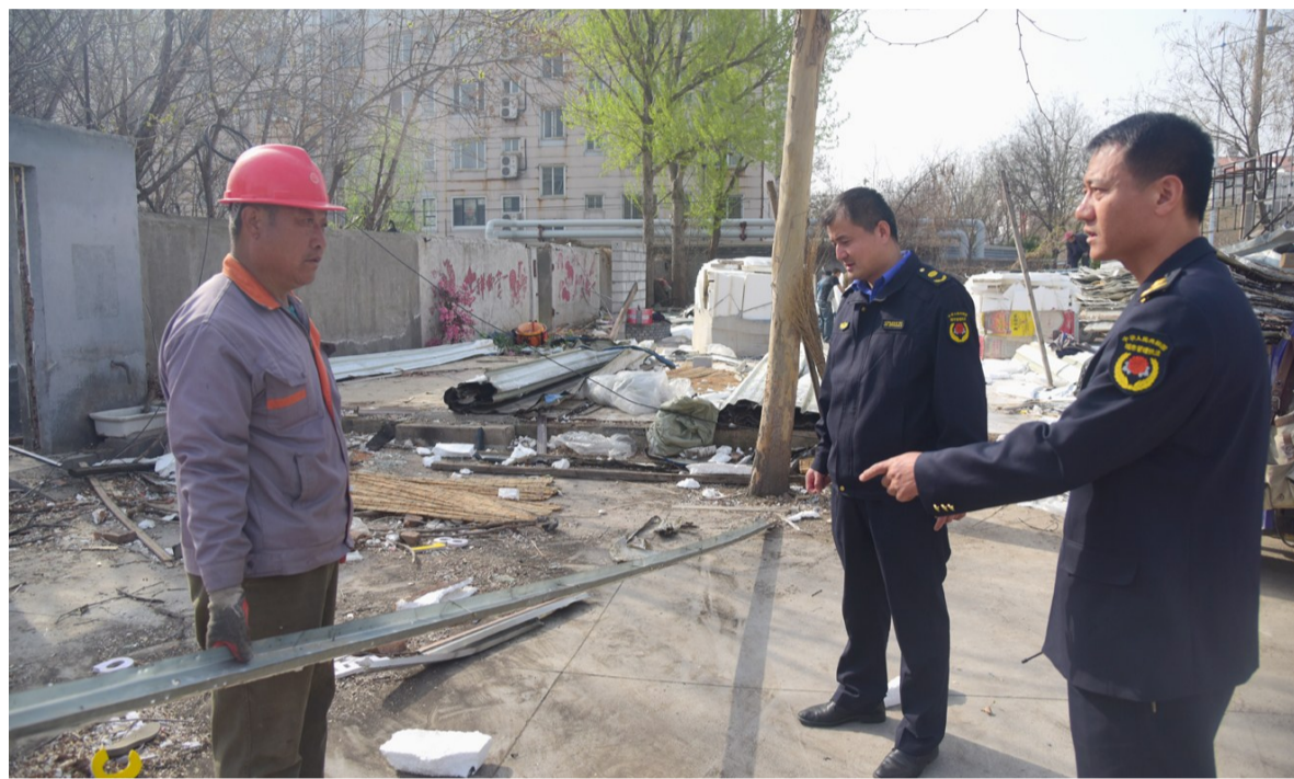
执法队员现场指导拆除。

拆除一户、清理一户”的原则，坚持刚性执法不动摇，时刻坚守执法底线，并分类施策，逐一确定搬迁、拆除时间，并下达拆除通知书。同时，坚持以人为本，突出人性执法，结合实际适当延长商户、公司搬迁时间，确保商户顺利搬迁、平稳转移；帮助当事