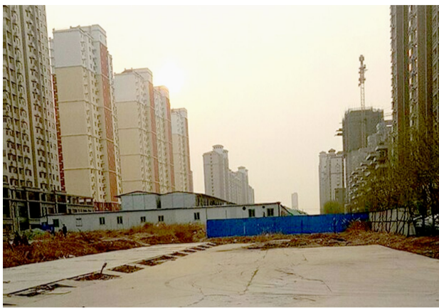
第三处违建拆除后。