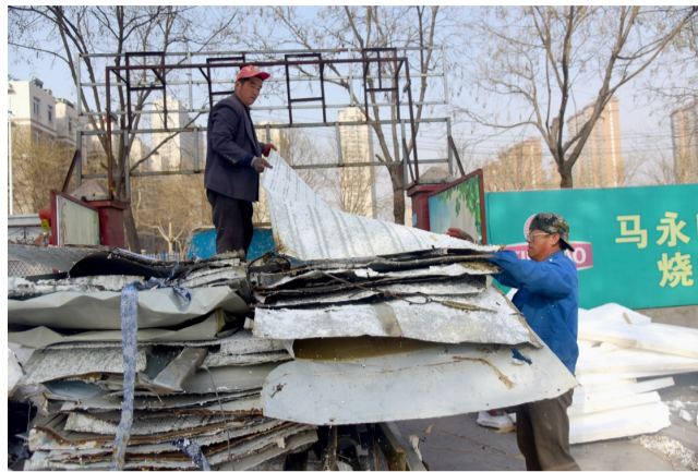
工人对拆除后的物资装车。