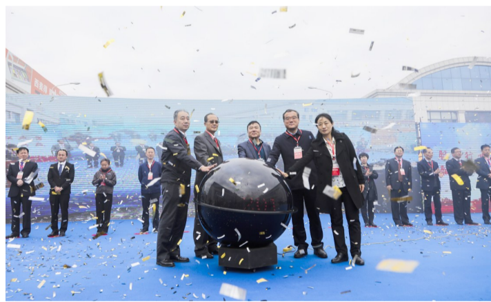
与会领导共同启动启动球。

据了解,此次展会将持续3天,预计将有数万人到场交流。为方便客户顺利到达展会现场,会展组委会还为来自全国各地的参观采购商提供了免费优质大巴接送服务。