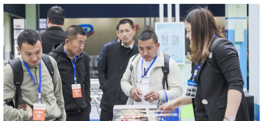
展会上展出的无烟烧烤炉吸引了不少参会人员目光。