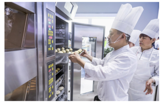
美厨厨业推出的智能烤箱能够披萨、面包、饼干同时烤,而且不串味。