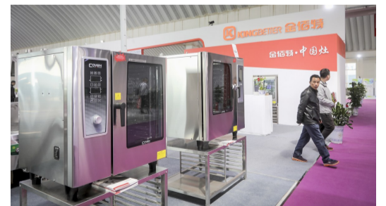
金佰特公司推出的万能蒸烤箱,既能蒸又能烤,同时食品口味保证一致。