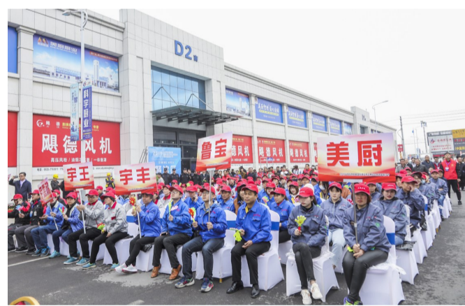
中国智慧厨都的厨具代表企业员工出席开幕式。