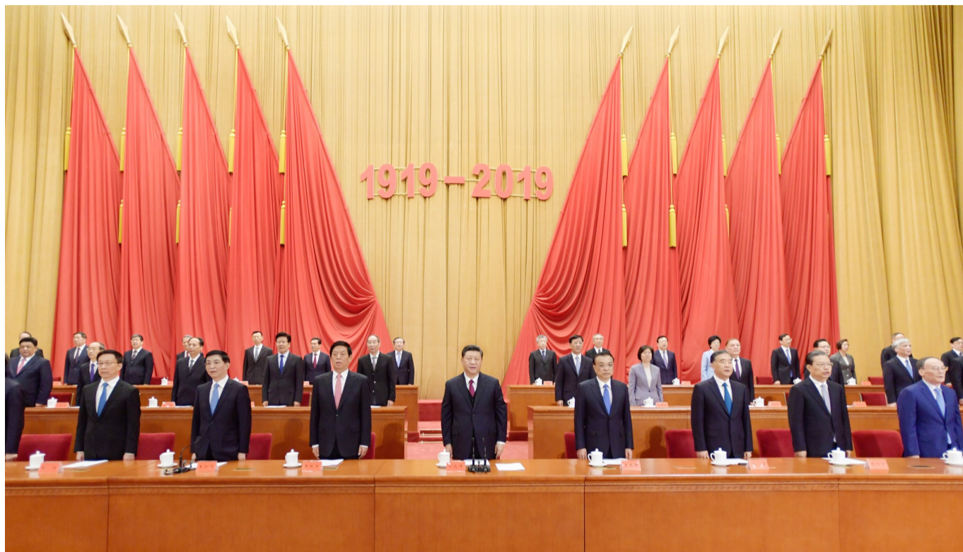
4月30日，纪念五四运动100周年大会在北京人民大会堂隆重举行。习近平、李克强、栗战书、汪洋、王沪宁、赵乐际、韩正、王岐山等出席大会。新华社发

新华社北京4月30日电 纪念五四运动100周年大会30日上午在北京人民大会堂隆重举行。中共中央总书记、国家主席、中央军委主席习近平在会上发表重要讲话强调，五四运动以来的100年，是中国青年一代又一代接续奋斗、凯歌前行的100年，是中国青年用青春之我创造青春之中国、青春之民族的100年。新时代中国青年运动的主题，新时代中国青年运动的方向，新时代中国青年的使命，就是坚持中国共产党领导，同人民一道，为实现“两个一百年”奋斗目标、实现中华民族伟大复兴的中国梦而奋斗。