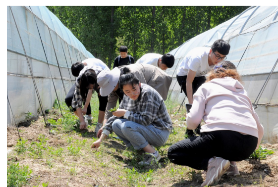
学生们采摘野菜,体验采摘的快乐。