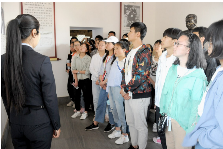
学生们参观怀周祠。