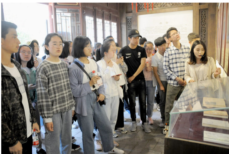
学生们参观杜受田故居。