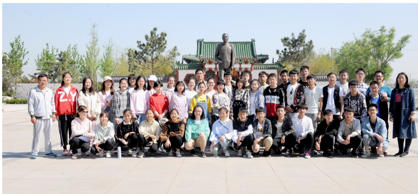
学生们在周总理塑像前留影。

中午时分,学生们来到了位于滨城区梁才街道办事处龙崖种植专业合作社。孩子们先后参观了鲁北地区最大的梅园——盛泽梅苑、蔬菜瓜果种植大棚、