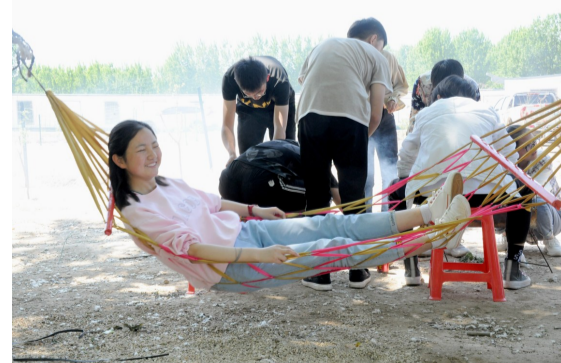
在田园风光中惬意过节。

有限公司和青海省民族班的师生第四年一起过节了。滨州市大有新能源党支部作为非公企业典范,积极践行社会责任,维护民族团结,搭建起了滨州与青海祁连文化沟通的桥梁。