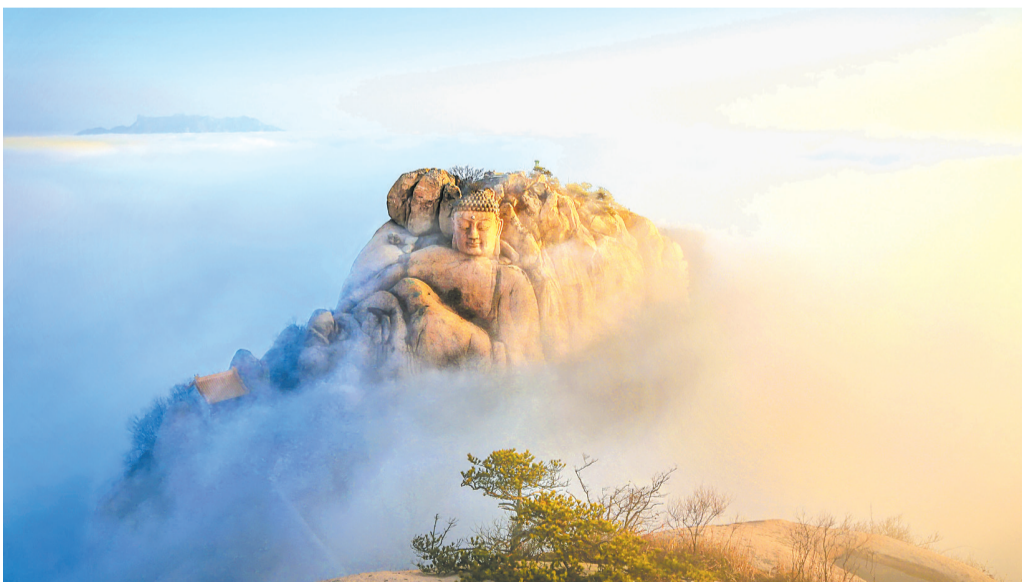
五莲山自然风光秀丽,被誉为“海右独秀”“仙境五莲”,是中国最美的100座名山之一。