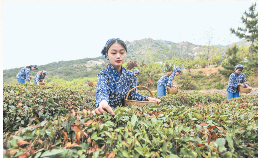
日照春茶进入采摘季节。