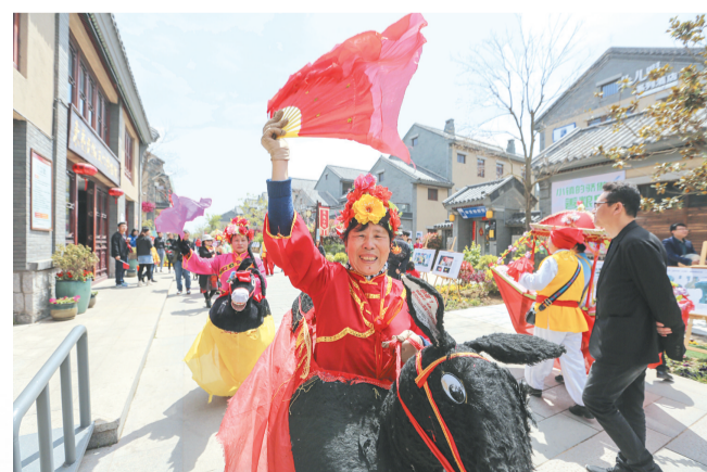
东夷小镇非遗文化展演。