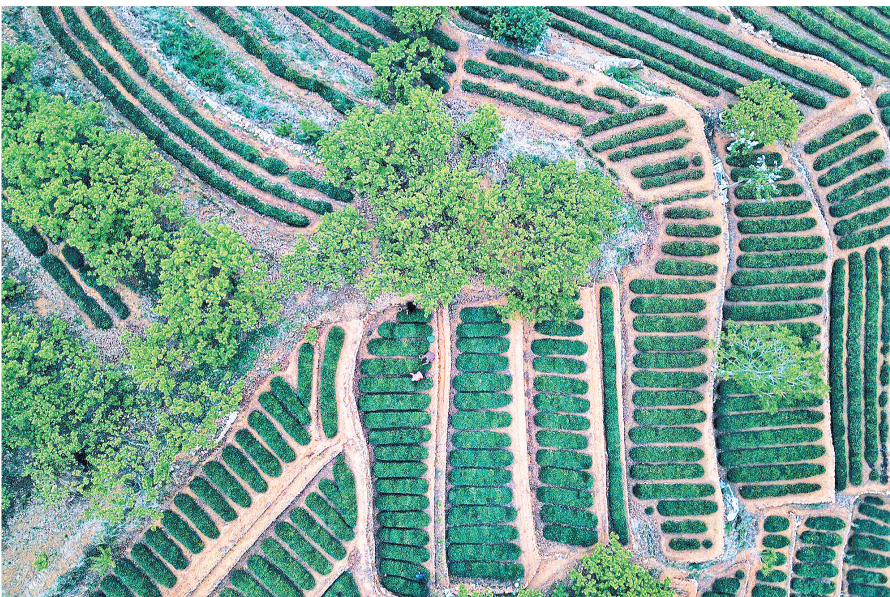
漫山遍野的茶树错落有致似层层波浪。