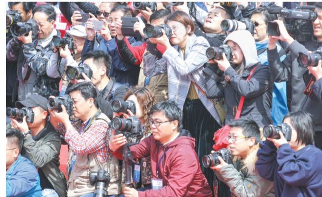
百家媒体聚焦中国新闻摄影周活动。