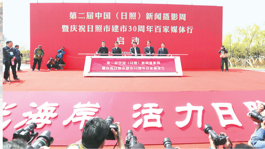
新闻摄影周启动仪式。

仪式后,与会领导嘉宾和媒体记者分组到日照海洋公园、日照万平口景区、世帆赛基地、大暖帐诗茶小镇、五莲山白鹭湾田园综合体、龙门崮田园综合体、中兴汽车、山海国际杜鹃花展、桃花岛景区、日照海滨国家森林公园、花仙子风景区、巨峰镇小茶山文旅综合体、莒县浮来青旅游度假区、创泽机器人项目等现场进行采访采风。活动同时启动第二届中国(日照)新闻摄影周暨“第二届发现日照之美”新闻摄影大赛。