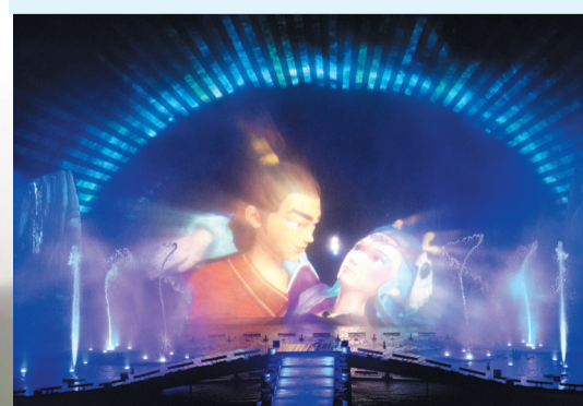
美轮美奂的日出东方·海之秀演出。