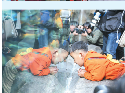
新型海洋公园将海洋馆与花鸟园完美融合。