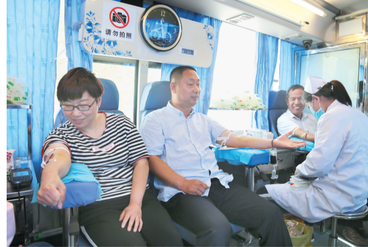
近日，滨州市中心血站献血车开进了秦皇台乡政府大院。各单位干部职工和热心群众在献血车前排起了长队，在医务人员的引导下，大家按序填写登记表，排队抽血化验，经血液检验合格后无偿献血。