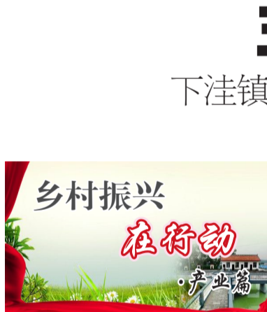
乡村振兴 在行动 产业篇