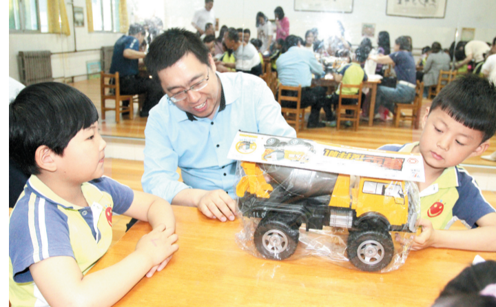
5月21日，邹平市韩店镇妇联组织热心公益的30名“爱心妈妈”、10名“爱心爸爸”志愿者来到镇中心幼儿园，给小朋友们送上书包、文具、衣服、玩具等礼物。

结合对标学标，该办以新视野、新思维积极探索“机构编制+动态评估”管理模式，坚持“瘦身与健身相结合”，积极挖潜增效，做到该加的加、该减的减。对管理手段升级、职责任务弱化，可以有效腾出编制资源的部门和领域加大精简力度；对职责增加较多、承担任务较重、确需保障的重点领域、重点部门及基层一线予以充实加强，确保职能强化部门在编制资源上“吃饱、吃好”，为滨城更高质量发展提供编制资源保障。