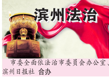
市委全面依法治市委员会办公室、滨州日报社 合办

据统计，2019年以来，无棣县共开展“法治大喇叭”普法宣传300余期，“法治大喇叭”已经成为该县一个重要的法治宣传阵地，“法治之声”将传遍农家院落、田间地头。