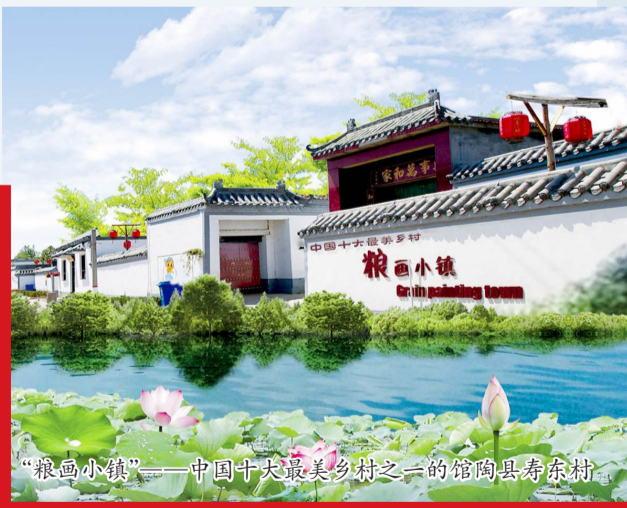
“粮画小镇”——中国十大最美乡村之一的馆陶县寿林村