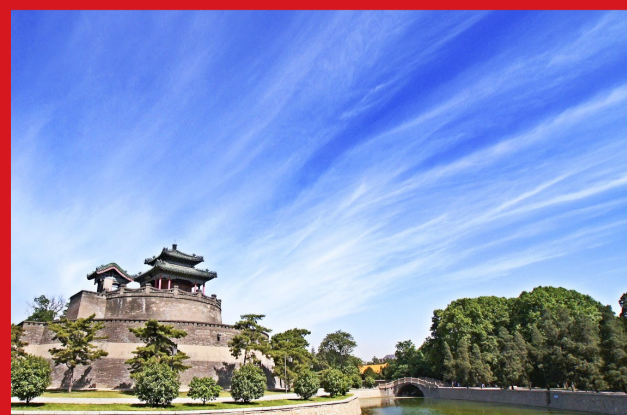
古城的标志性建筑——武灵丛台