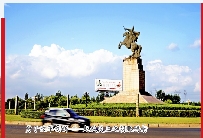
勇于改革创新——赵武灵王之胡服骑射