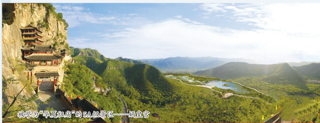
被誉为“华夏祖庙”的5A级景区——娲皇宫