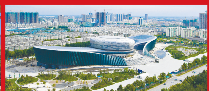
“城台上的美玉”——邯郸文化艺术中心