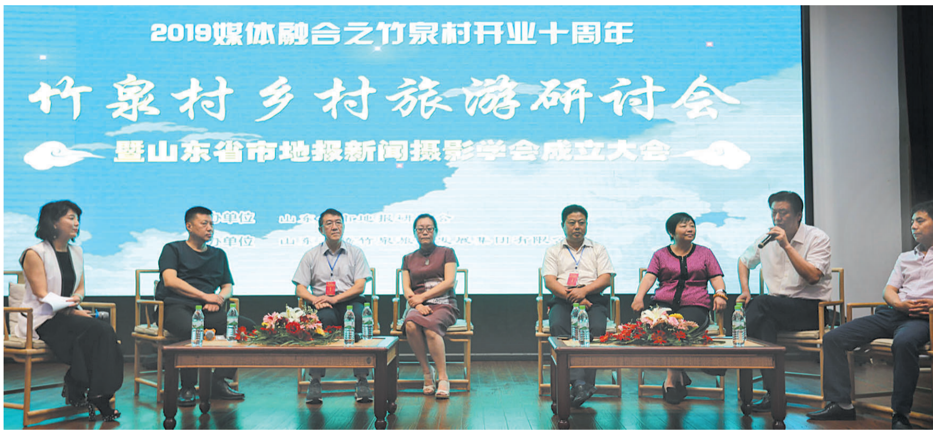
媒体负责人与旅游专家、乡村旅游开发者一起探讨乡村旅游发展与宣传。

在当日的论坛中,各市地报负责人和记者们表示,将深入探讨和实践融媒体时代与乡村旅游开发的结合文章,助力乡村建设。