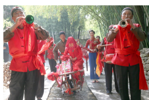
竹泉村的民俗婚礼。