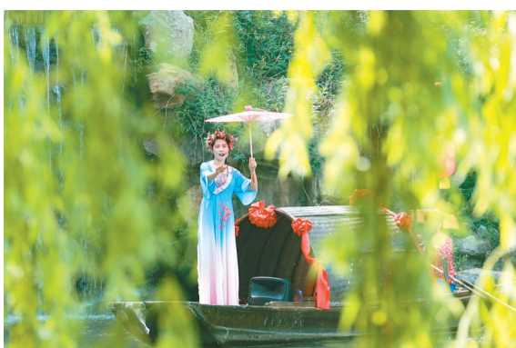
乘着乌篷船,演绎诗情画意。