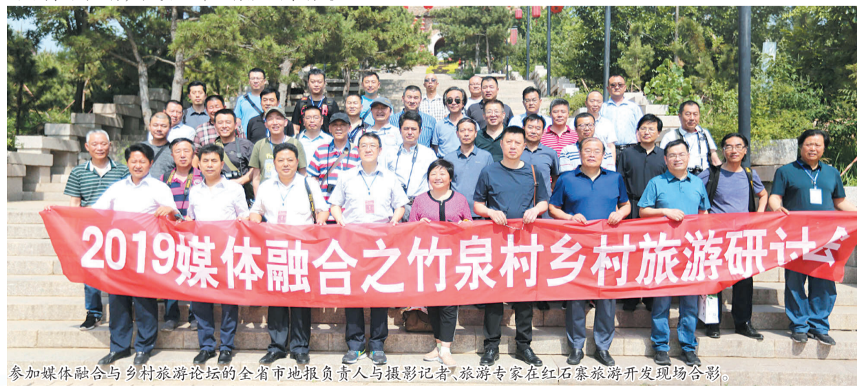
参加媒体融合与乡村旅游论坛的全省市地报负责人与摄影记者、旅游专家在红石寨旅游开发现场合影。