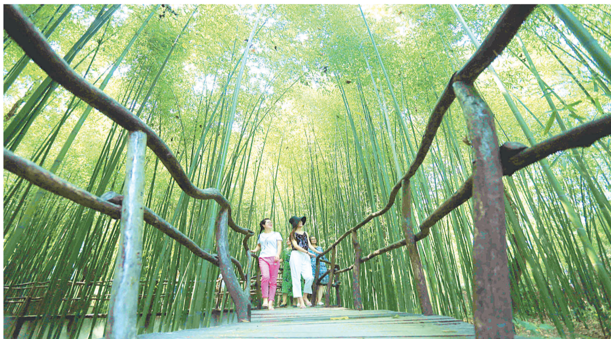
竹林、泉水、古村,构成了百年古村落“竹泉村”。