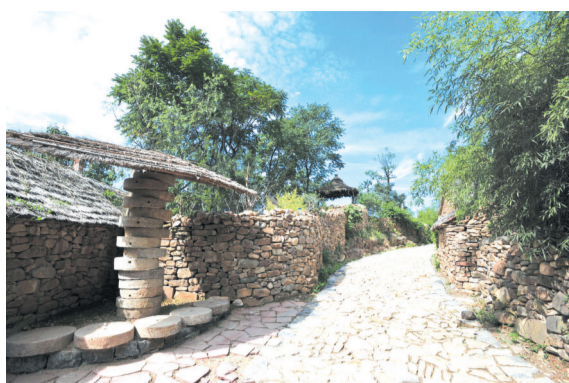
古老山村有了新的生命力。