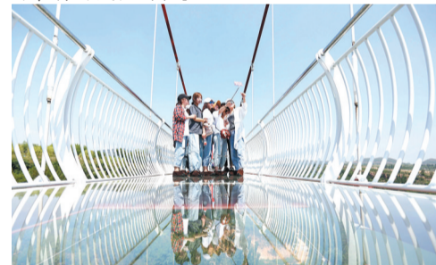
空中玻璃桥上体验沂蒙山的高度。