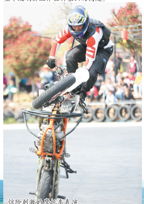
惊险刺激的摩托车表演。