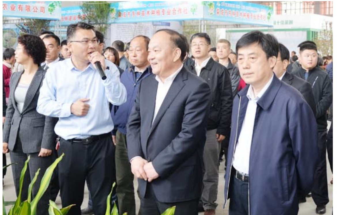
市委副书记、市长宇向东,副市长郝吉虎出席第八届黄河三角洲(滨州·惠民)绿化苗木交易博览会。

2018年12月30日,滨州市自然资源和规划局挂牌成立,标志着我市正式开启了“山水林田湖草”生命共同体整体保护、系统修复、综合治理的新时代,从此肩负起“统一行使所有自然资源资产所有者职责,统一行使所有国土空间用途管制和生态保护修复职责”的新使命,全市自然资源和规划管理事业站在了新的历史起点上。