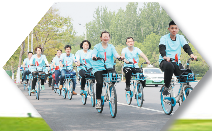
倡导绿色节约的健康生活方式,以实际行动助力资源节约。