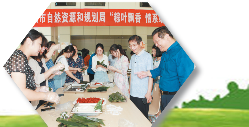
弘扬传统文化,打造文明机关。