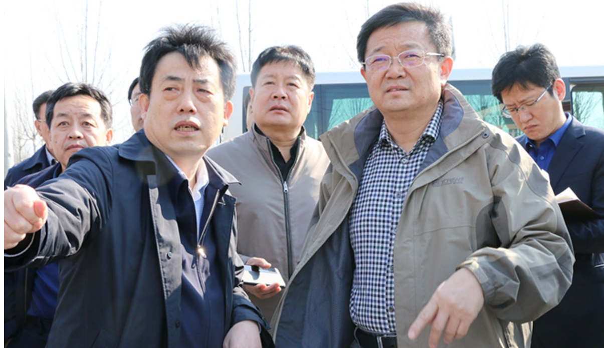
市委书记、市人大常委会主任余春明现场调研自然资源和规划工作。