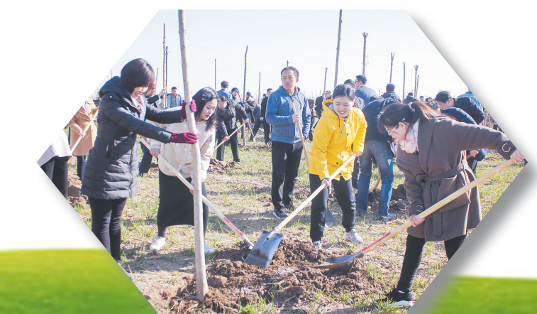
第二个十年林业会战启动,组织开展植树造林,争创全国森林城市。

季全市完成造林面积32.77万亩,争取年内森林覆盖率达到30%,增加居民的生态获得感。扎实推进矿山地质环境恢复治理,完成矿山复绿、地质环境治理21公顷。规范林地湿地管护,探索建立林长制,推行建立市、县、乡、村四级林长制体系,实行林地用途管制、森林采伐限额管理、征占用林地植被恢复台账等制度,落实湿地面积总量管控,防止发生林地、湿地资源非法占用、流失现象。