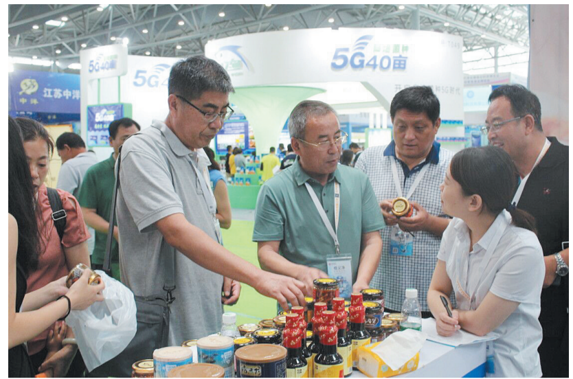
我市参展人员积极与其他参展方对接洽谈。

据悉,中国国际现代渔业暨渔业科技博览会已成功举办两届,是集展览展示、经贸洽谈、产品推介、技术发布于一体的行业盛会。本届展会吸引了以色列、韩国、日本等国家和地区,以及国内北京、上海、广东等省市的550家企业参展,不仅参展企业及展商数量众多,展品类别相较于往届也有了明显提升。其间,我市参展人员还前往安徽小老海实业集团等地,对当地特色水产养殖及休闲渔业项目进行了考察和学习。