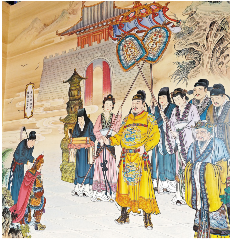
无棣大觉寺歌脚殿壁画“唐宗诏册书，敬德建宝刹”。

亦有学者认为，“尉迟恭”是尉迟敬德的曾用名，也就是尉迟敬德从政期间公认之名。证据是1970年代初，尉迟敬德墓志出土，尉迟敬德名“融”始布天下。