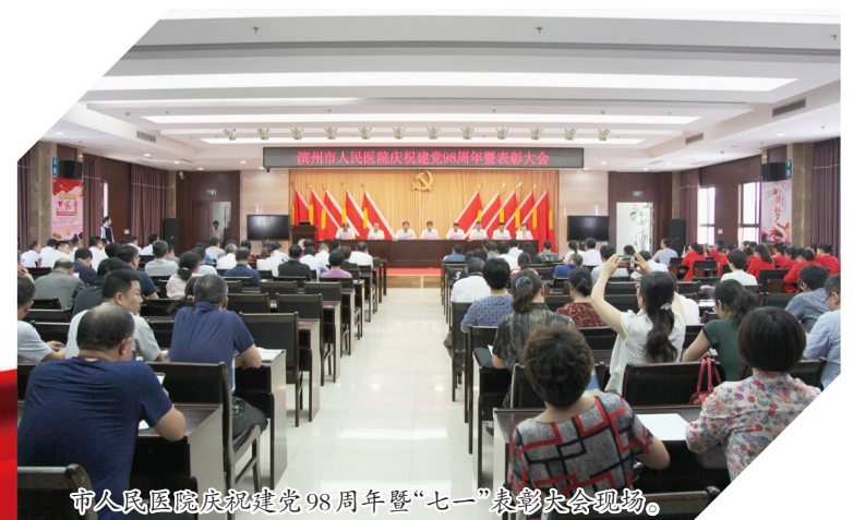
市人民医院庆祝建党98周年暨“七一”表彰大会现场。