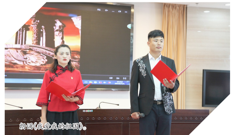
合唱《我爱我的祖国》。