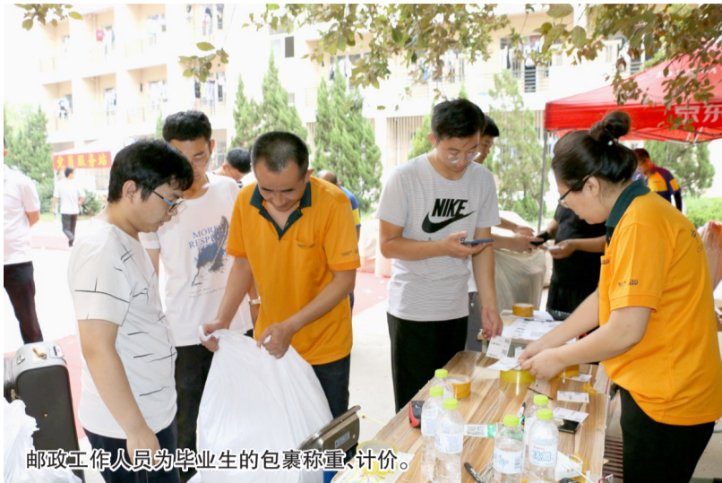
邮政工作人员为毕业生的包裹称重、计价。

在滨州学院人文学院毕业班宿舍楼下,毕业生的行李已堆成一座“小山”。一名来自山西的毕业生正在邮政服务点寄包裹。“这是最后一包东西,其它的前两天都寄走了。这几天