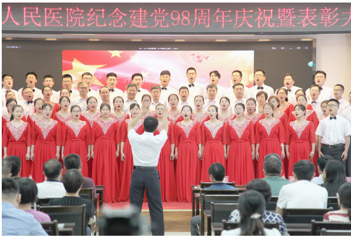
医院合唱团唱响《中国之梦》。