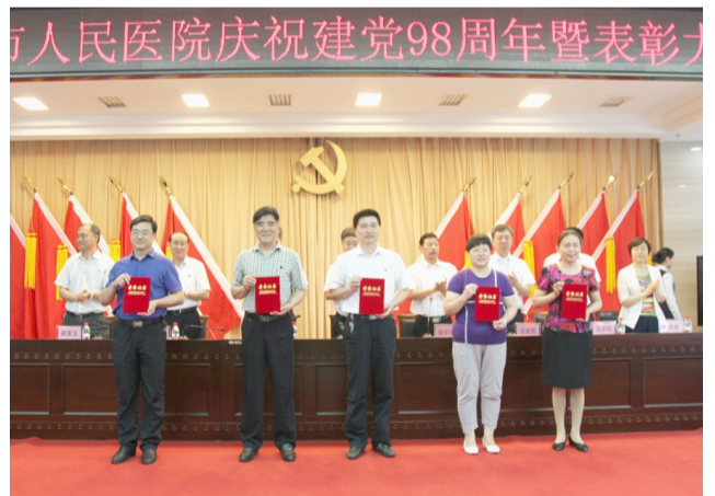
优秀党支部书记领取荣誉证书。